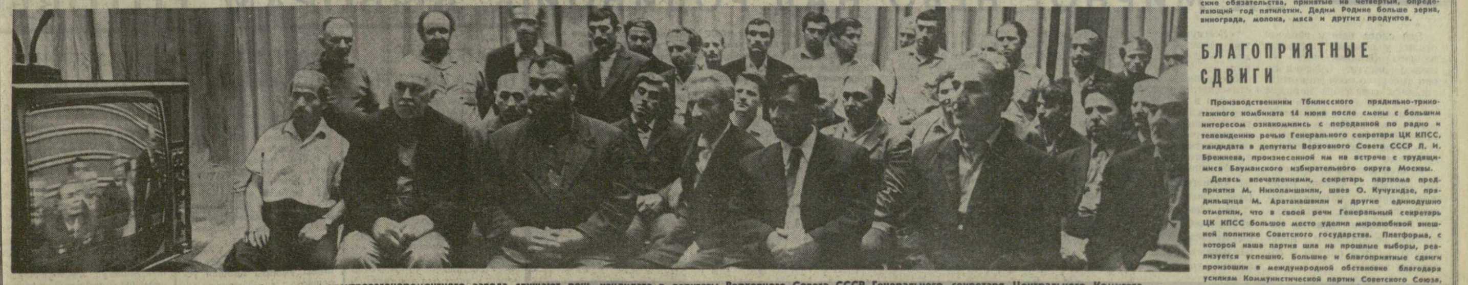
● РАБОЧИЕ И СЛУЖАЩИЕ Тбилисского электровагоноремонтного завода слушают речь кандидата в депутаты Верховного Совета СССР Генерального секретаря Центрального Комитета Коммунистической партии Советского Союза товарища Л. И. Брежнева.

Производственным Тбилисского пряльно-трикотажного комбината 14 июня после смены с большим интересом ознакомилась с переданной по радио и телевидению речью Генерального секретаря ЦК КПСС, кандидата в депутаты Верховного Совета СССР Л. И. Брежнева, произнесенной на встрече с трудящимися Бауманского избирательного округа Москвы.