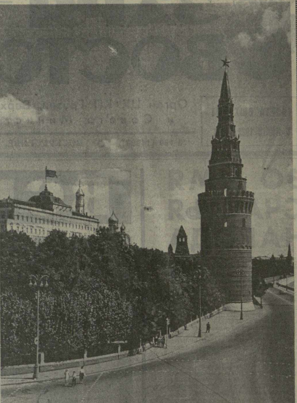
На снимке: Москва. Кремль. Здание Верховного Совета СССР. (Фотохроника ТАСС).

Обе палаты Верховного Совета избираются на один и тот же срок (четыре года), в одно и то же время, без частичных обновлений. А как пример, сенат во Франции может быть избран на 9 лет, сенат в США — на шесть лет, в Англии палата лордов вообще не избирается, а состоит из наследственных членов. А вот «нижние» палаты в этих странах избираются на меньший срок (палата представителей США — на 2 года, палата общин в