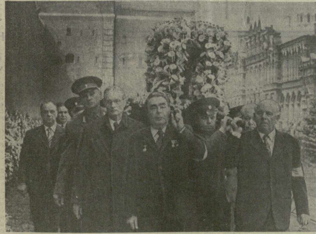
21 июня в Москве состоялись похороны выдающегося советского полководца, одного из активных строителей Вооруженных Сил СССР, прославленного героя Великой Отечественной войны, четырехжды Героя Советского Союза, Маршала Советского Союза Георгия Константиновича Жукова. На снимке: руководители Коммунистической партии и Советского правительства несут урну с прахом Г. К. Жукова.