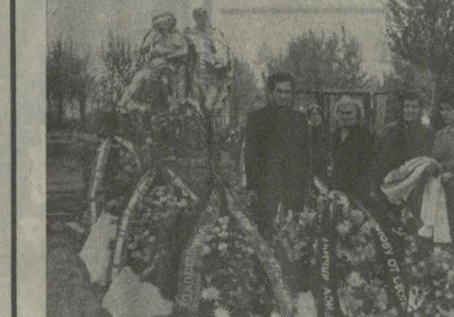
Советские люди бережно хранят память о тех, кто не вернулся с поля сражений Великой Отечественной войны.

Живет в сердце народа память о годах Великой Отечественной, о тех, кто не пришел с войны, кто отдал свои жизни, чтобы приблизить нашу победу. Живут в памяти людской имена простых зарней в солдатских шинелях, в суровую годину отстоявших от врага свою Родину, повергнувших ниц того, кто пришел к нам с мечом.