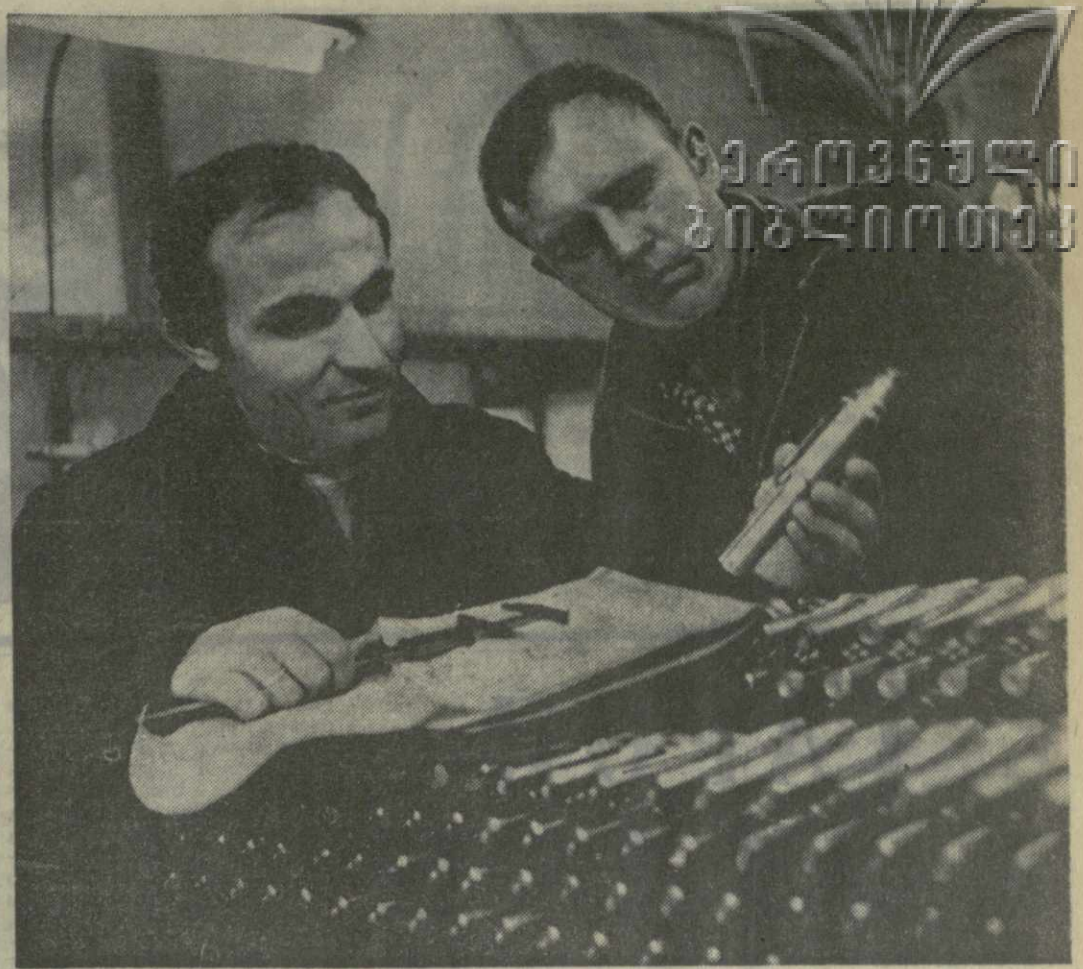
Слушатели школ посетили Туапсинский нефтеперерабатывающий завод, там была познана интересующая их технологическая документация, инструкции и др.