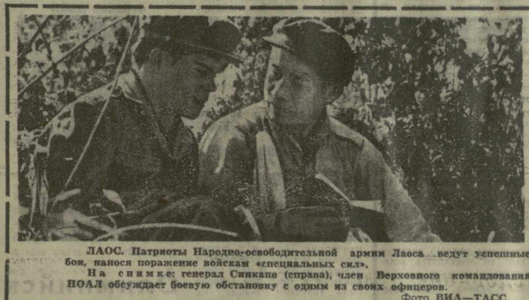
ЛАОС. Патриоты Народной-освободительной армии Лаоса ведут успешные бои, наносит поражение войскам «специальной сил».

подступах к Данангу. Патриоты атакуют позиции противника на магистрали, связывающей этот крупный порт с внутренними районами страны. За 4 дня — с 31 июля по 3 августа — американско-сайгонские артиллерия выпустила по этому провинциальному центру более 50 тысяч снарядов. 2 и 3 августа было использовано химическое оружие против населения города Куанчи и уездов Чуэуфай, Лаванг и Хайланг. Имеются большие человеческие жертвы, некоторые деревни уничтожены полностью. Давая отпор врагу, части Народных вооруженных сил освобождения провинции Куанчи за месяц вывели из строя более 10 тысяч солдат и офицеров сайгонской армии, уничтожили и захватили большое количество военной техники.