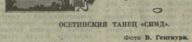
ОСЕТИНСКИЙ ТАНЕЦ «СИМД».