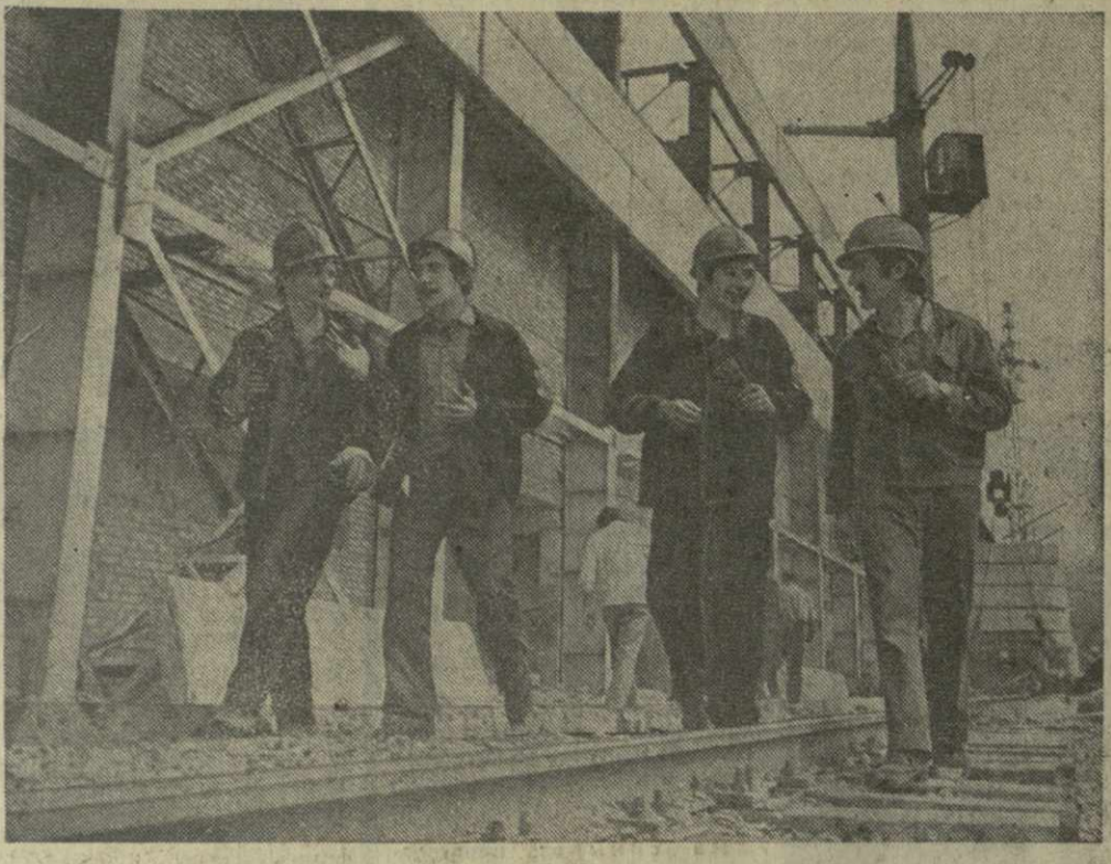
БОЛЕЕ Сорока студентов ГПИ в эти дни участвуют в строительстве Магднуловского горно-обогатительного комбината.