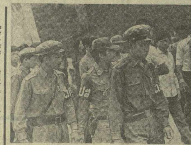
А. ЛАОС. После решения первоочередных вопросов, связанных с нейтрализацией городов Луангпхабана и Вьянтиана и создания совместных полицейских сил, действующих в этих городах, продолжается осуществление остальных пунктов соглашения о восстановлении мира и достижении национального согласия в Лаосе. На снимке: смешанный вьетно-кхмерский отряд в Луангпхабана.