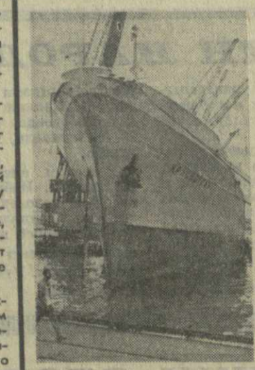
Советский торговый теплоход «Красноград» в Гаванском порту под разгрузкой.