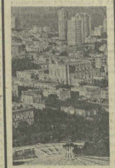
ГАВАНА — столица острова Свободы.