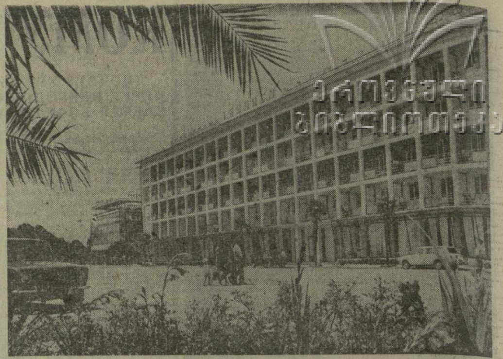
● СУХУМИ СЕГОДНЯ. Гостиница «Тбилиси».