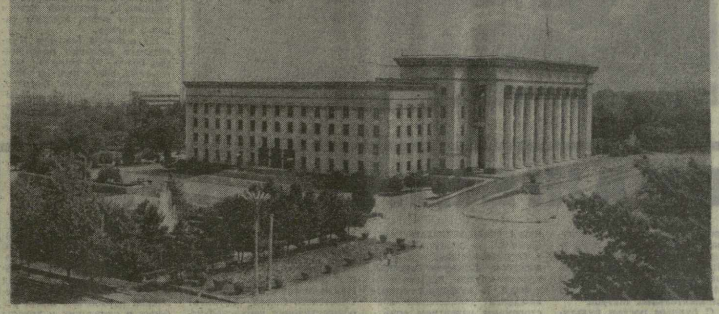
Столица Казахской ССР — Алма-Ата. Дом Совета Министров и ЦК Компартии Казахстана.

На юбилейном марше — Советский Казахстан