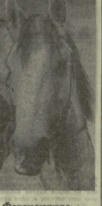
СССР 50 Фотоконкурс «Заря Востока»