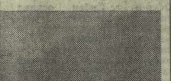
Как сообщил корреспондент ТАСС начальник Главташкентгипрогор Т. М. Саркисов, уже

В начале формирования Строительного полка, который будет вести работы в Тбилиси. Ташкентцы приедут на свою новую стройплощадку с автомобилями, бульдозерами, башенными кранами, бетономешалками. На специальных платформах, которые будут курсировать между двумя городами, придут все детали домов — от фундаментов до крыши. Сроки, отведенные на сооружение, сжаты. Уже в будущем году четыре дома поднимутся на вьезде в самый молодой район Тбилиси, возводимый строителями союзных республик.