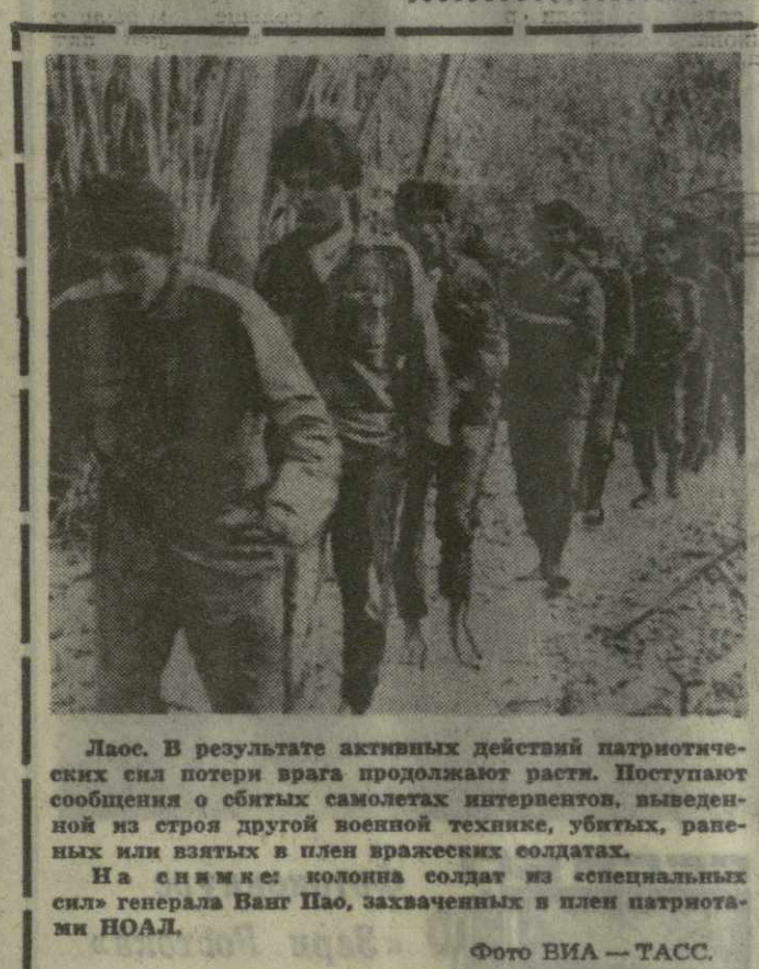
Лаос. В результате активных действий патристических сил потери врага продолжают расти.

особенности отношений с Советским Союзом имеются значительные возможности в области торговых отношений. Также же возможности имеются и в сфере научного и культурного обмена.