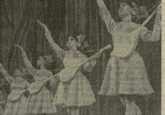
Алма-Ата, Казахский молодежно-эстрадный ансамбль «Гульдер» — ему всего два года — но своим мастерством он завоевал сердца поклонников эстрады. Коллектив побывал с концертами во всех областях республики, выступил в Москве, Ленинграде, Тбилиси и других городах страны. Сейчас молодые артисты готовят новую программу — «Струны степей».

На снимке: танцевальная группа ансамбля.