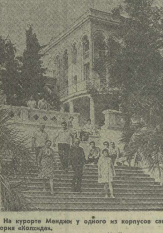
На курорте Менджи у одного из корпусов санатория «Колхида».