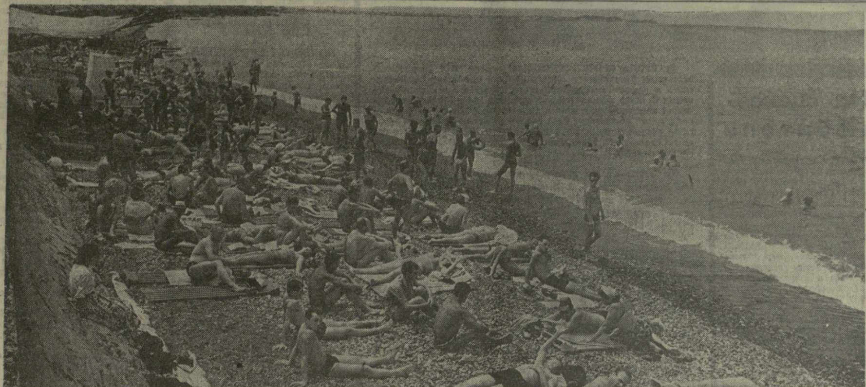
Тысячи отдыхающих посещают ежегодно знаменитый курорт Черноморского побережья Грузии — Зеленый Мыс. К их услугам представлены комфортабельные санатории и дома отдыха, пансионаты.

О том, как проходит курортное лето-74 в здравницах нашей республики, — рассказ на этой странице.