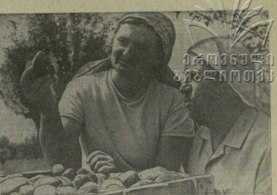
● ОБИЛЬНЫЙ УРОЖАЙ вырастили овощеводы Квирицского молочно-овощеводческого совхоза Хашурского района. Со 170 гектаров непрерывным конвейером в торговую сеть идут помидоры, огурцы, зелень.

Наращивая темпы жатвы, механизаторы закладывают основу будущего урожая. В колхозах и совхозах Российской Федерации начался сев озимых. Во втором миллионе гектаров развернулась вспашка земли. Начали подготовку августовской земли в Казахстане, Молдавии и других республиках. (ТАСС).