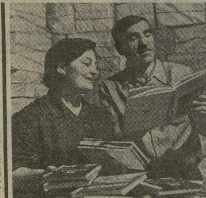
Десятки тысяч экземпляров учебников для школ Грузии выпускает к новому учебному году Тбилисский комбинат печати. Уго жетовы «Деда зна» для подготовительных и первых классов, «Русское слово» и «Русский язык», «Математика» и многие другие.

Коллегия Всесоюзного объединения «Союзсельхозтехника» Совета Министров СССР и президиум Центрального комитета профсоюза рабочих и служащих сельского хозяйства и заготовочной определены победители Всесоюзного социалистического соревнования коллективов в предприятной «Союзсельхозтехники» по итогам работы за второй квартал. Среди победителей — коллектив Тбилисской реализационной базы республиканского объединения «Грузсельхозтехника» Совета Министров Грузинской ССР. Ему присуждены переходящее Красное знамя «Союзсельхозтехники» и Центрального комитета отраслевого профсоюза и первая денежная премия.