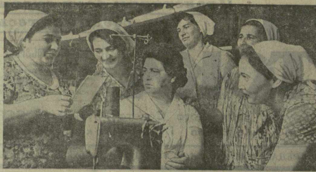
ДОСРОЧНО вышли на рубеж первого полугодия члены бригады коммунистического труда тбилисской фабрики «Грузтротман». Сейчас, заново обдумав свои обязательства, они взяли новое обязательство — выполнить годовой план к первому декабрю.