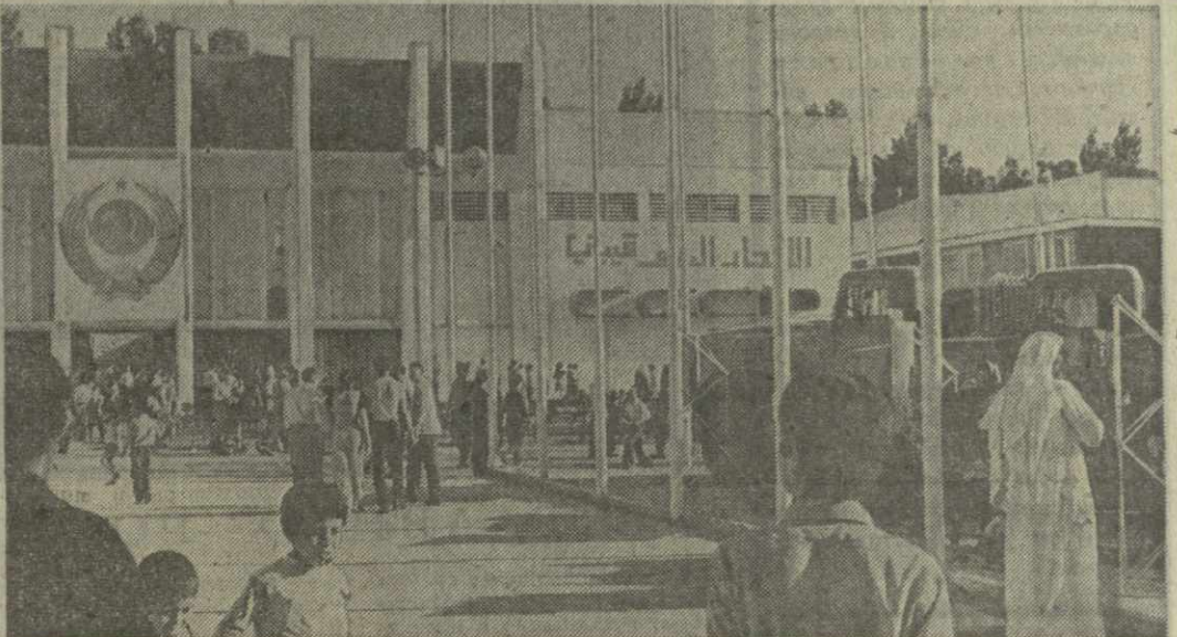
● В ЭТОМ ГОДУ на 21-й международной ярмарке в Дамаске представлены 15 советских внешнеэкономических объединений, экспортирующих товары, которые могут заинтересовать деловые круги Сирии. Особое широко демонстрируют свои товары также объединения, как «Станкомпорт», «Энергомашинэкспорт», «Международная книга». На снимке: у павильона СССР.

ЖЕНЕВА, 13 августа. (ТАСС). Переговоры не прерваны, но прогресса достичь не удалось — так суммировал министр иностранных дел Англии Дж. Каллаган итоги вчерашнего дня на переговорах по Кипру. Весь день в Женеве вчера продолжались ожесточенные споры, на этот раз относительно конституционного устройства острова. В течение дня выявилось несколько планов конституционного устройства, но сейчас все внимание сосредоточено на плане, представленном Турцией. Детали его окончательно еще не ясны, но он предусматривает создание на острове автономных областей (кантонов) с греческим и турецким населением, которые должны быть объединены в федеративное государство. Турция ставит свое дальнейшее участие в переговорах в зависимости от принятия этого плана. По последним сведениям, Турция согласилась ждать 24 часа с тем, чтобы Греция и греко-киприотская сторона имели время для рассмотрения этих предложений. С другой стороны временно исполняющий обязанности президента Кипра Г. Клиридис, который представляет на переговорах греко-киприотов, заявил, что турецкие предложения неприемлемы. Он добавил, что сегодня представит свои предложения по конституционному устройству Кипра. Намечавшееся на сегодня пленарное заседание с участием министров иностранных дел трех стран — Англии, Греции и Турции и представителей греческой и турецкой общин Кипра отменено.