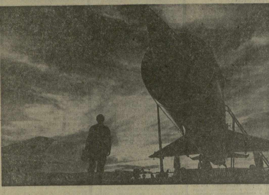
На снимке: в ночное небо.

Днем и ночью, в ясную погоду и в непогоду, над Ледовитым океаном, над тайгой и безбрежными степями славные воины Советских Военно-Воздушных Сил берегут мирный труд своего народа, зорко охраняя города и села, заводы и колхозные поля — все то, что зовем мы первым в мире государством рабочих и крестьян.