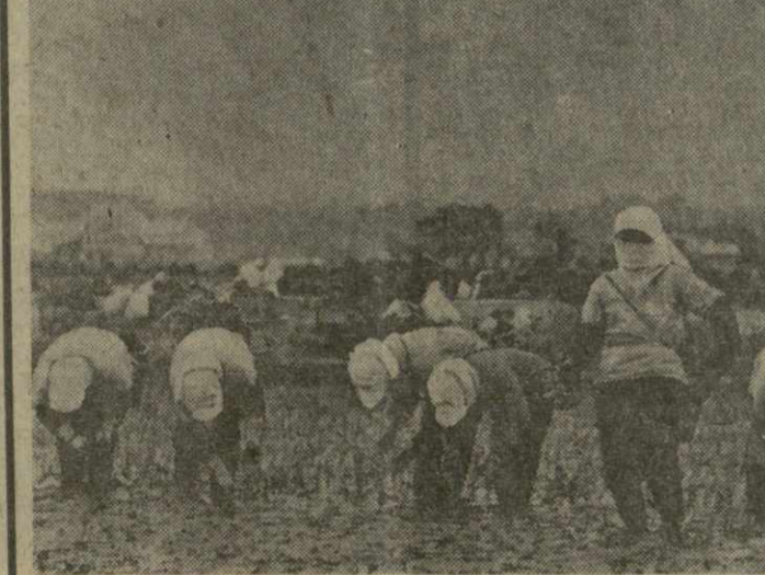
ЯПОНИЯ. Рисоводство продолжает оставаться наиболее трудоёмкой и наименее механизированной отраслью сельского хозяйства в стране. При выращивании риса на площади в один гектар на все операции — высадка рассады, прополку, борьбу с вредителями, уборку и очистку зерна — расходуется в среднем 300 человеко-часов. На снимке: высадка рисовой рассады.