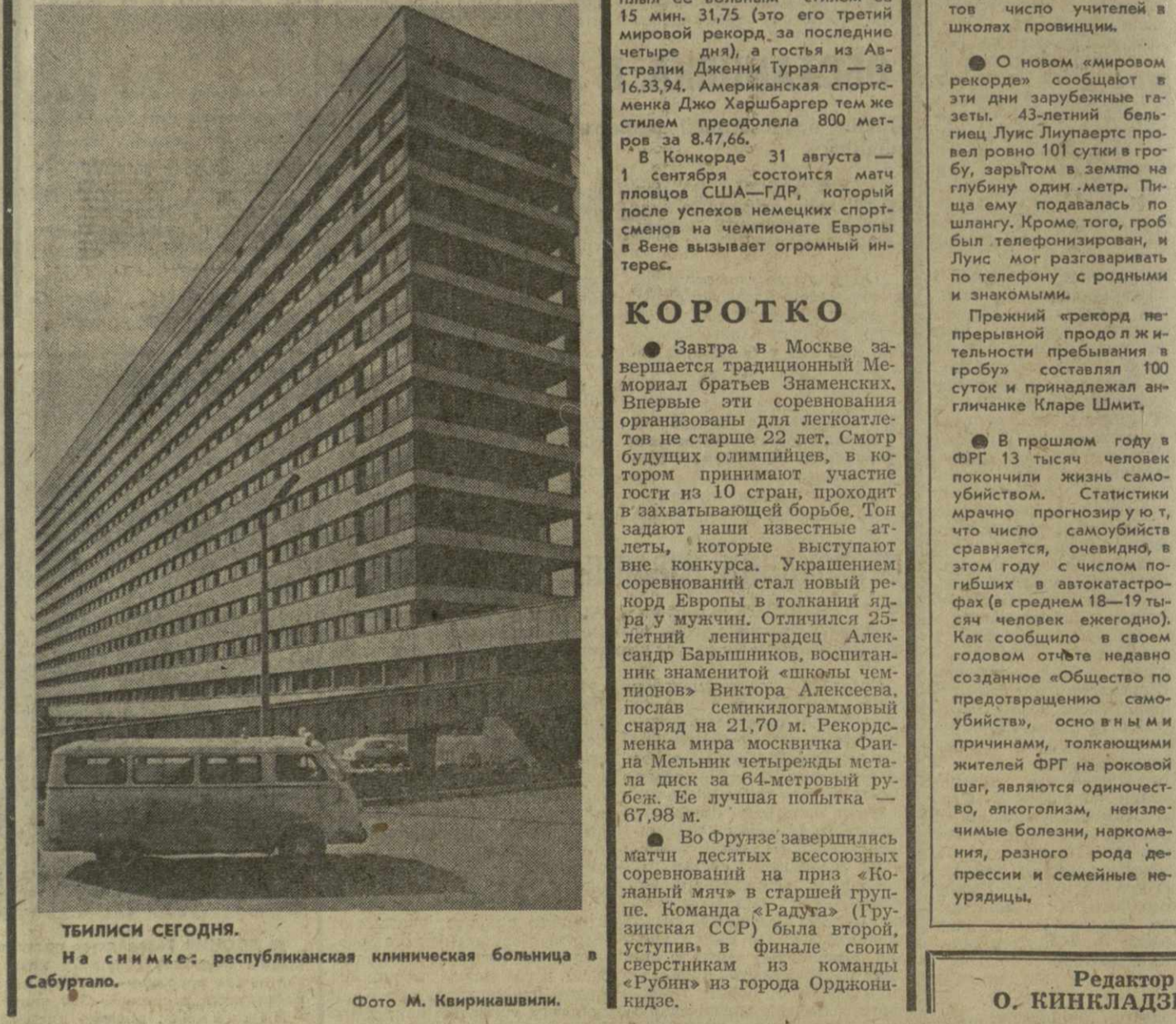
Тбилиси сегодня. На снимке: республиканская клиническая больница в Сабуртало.