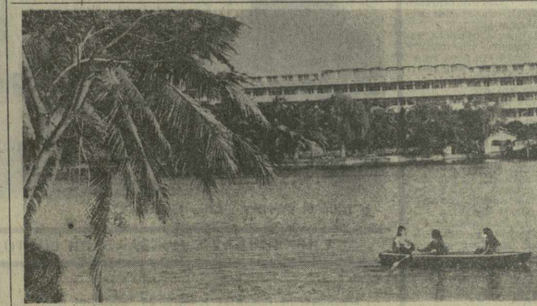
ДЕМОКРАТИЧЕСКАЯ РЕСПУБЛИКА ВЬЕТНАМ. Один из живописных уголков Ханоя — парк Единства. Вдали виднеется здание политехнического института, построенного с помощью Советского Союза.

Выступая на встрече с руководителями ДРВ в Ханое, Председатель Президиума ЦК НФЮ ЮВ доктор Нгуен Хью Тхо назвал 2 сентября славной датой в истории всего вьетнамского народа. Он подтвердил решимость южновьетнамского населения продолжать борьбу в защиту плодов революции, за выполнение парижского соглашения по Вьетнаму, за завершение национально-демократической революции.