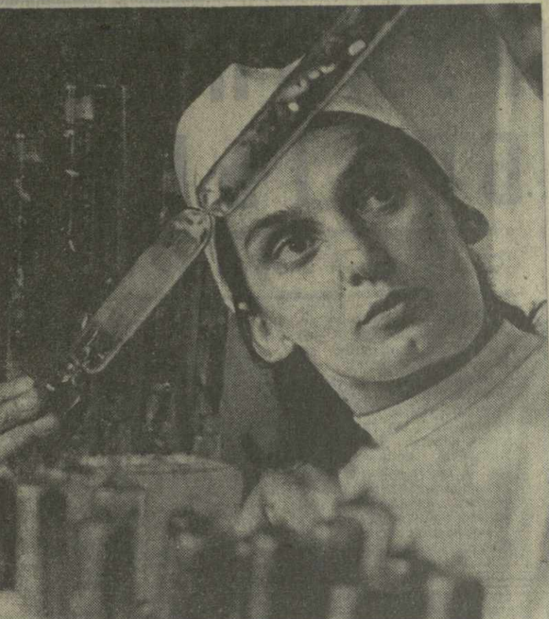
Высоко в горах расположились цехи Рачинского горно-металлургического комбината. Коллектив предприятия трудится самоотверженно и добивается высоких производственных показателей. Рабочие комбината обязались выпустить сверх годового плана продукции на десятки тысяч рублей.

В хозяйствах Сачхерского района в разгаре пахота под озимые. Успешно проводят ее колхозы сел Сарени, Саирхе, Аргвети. Земледельцы соревнуются за то, чтобы подготовить для сева две тысячи гектаров против плановых 1.800 гектаров.