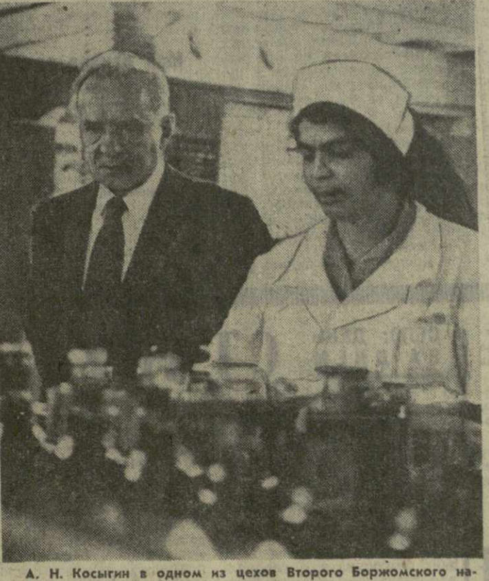
А. Н. Косыгин в одном из цехов Второго Боржомского ливочного завода.

В Новом Афонте Председатель Совета Министров Советского Союза ознакомился с уникальными Иверскими карстовыми пещерами, с их подземными озерами, в которых красуется целый лес причудливых сталактитов и сталагмитов. В глубь пещер, объем которых превышает миллион кубометров, любителей природы будет доставлять электрорельс. Сейчас тбилисские