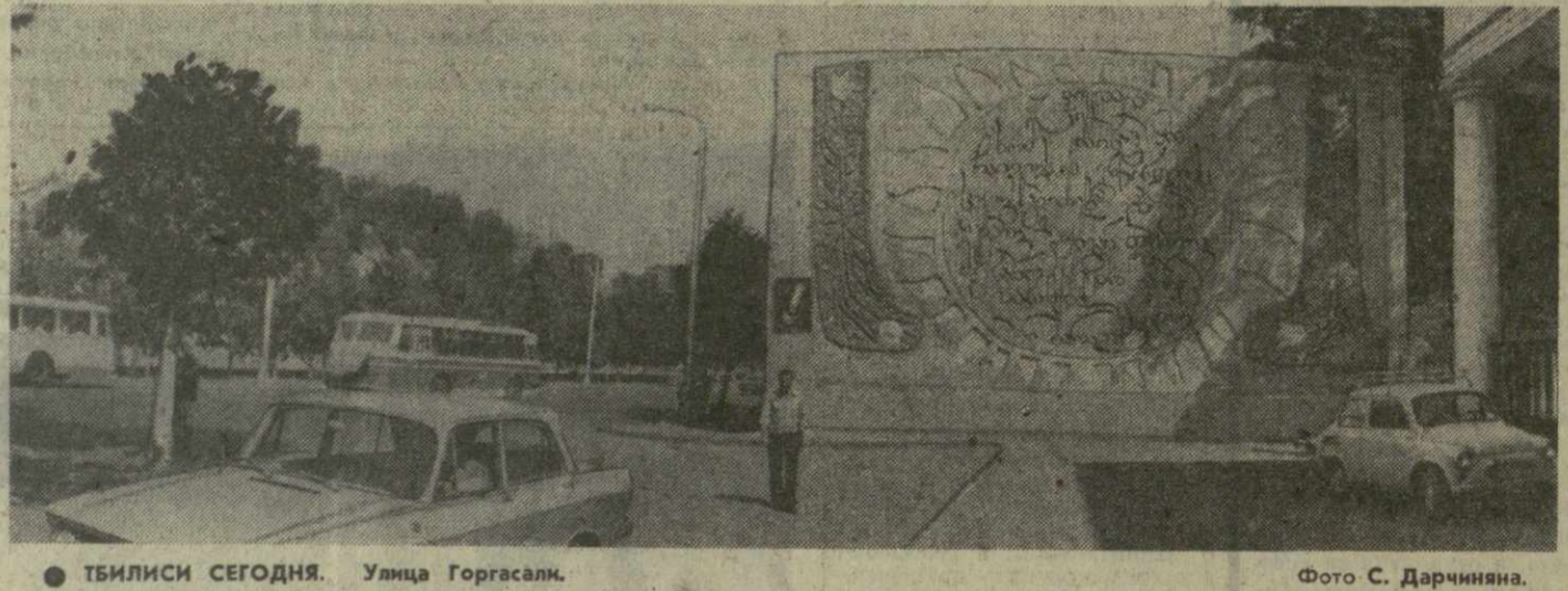
ТБИЛИСИ СЕГОДНЯ. Улица Горгасали.