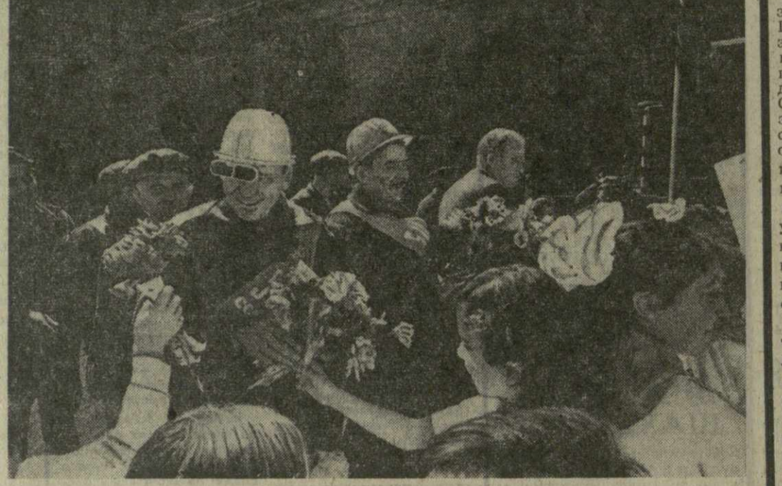
Труженники Рустави успешно соревнуются за досрочное выполнение задания пятилетки.

Город Джиданов, завод «Азотсиль». Кто в Рустави не знает об этом знаменитом предприятии, которое стало своеобразным университетом для многих грузинских металлургов? Украинские братья щедро передают нам свой богатый опыт. Крепко подружались рус-