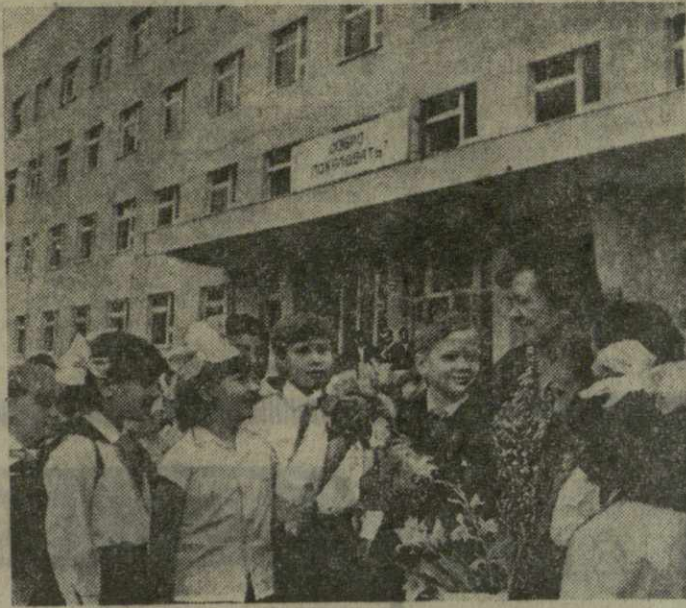
ТБИЛИССКАЯ СРЕДНЯЯ ШКОЛА № 136 начала отсчитывать свою биографию с нынешнего учебного года. Построена она на Гданском массиве и рассчитана на 1.320 учащихся. Наш фоторепортер запечатлел двор школы № 136 за несколько минут до первого звонка.

СПЕЦИАЛИСТАМ СВЯЗИ в процессе работы приходится иметь дело с самыми различными техническими средствами. Поэтому на факультете связи Тбилисского политехнического техникума большое внимание уделяется вопросам изучения и освоения современной аппаратуры. Первое занятие студентов третьего курса факультета состоялось в радиопередающей лаборатории.