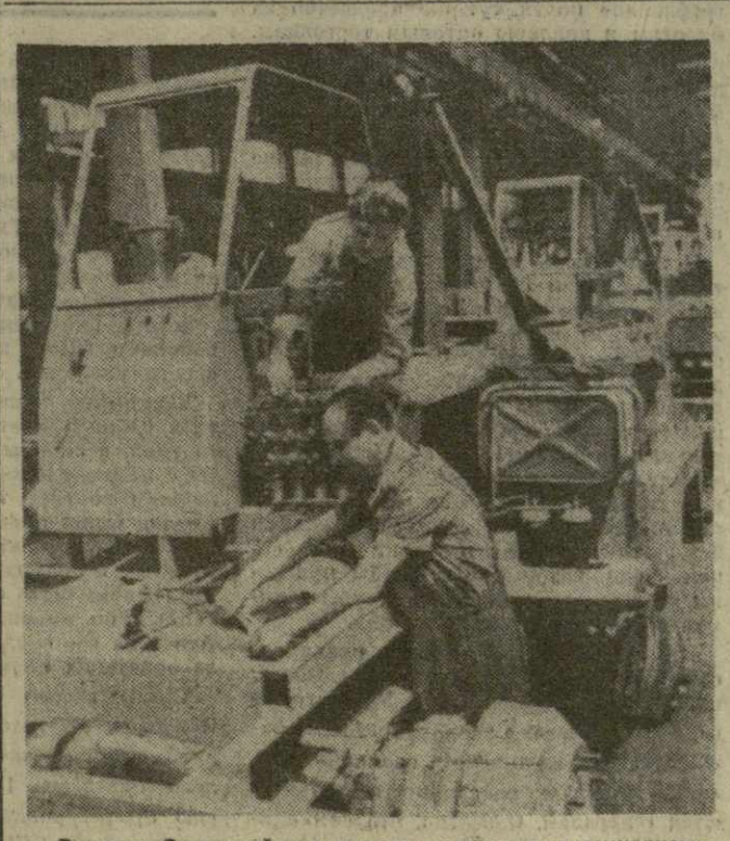
Венгрия. Во второй раз удостоен звания чеха социалистического труда один из рабочих коллективов будапештского тракторного завода «Красная звезда», который выпускает автоматизированные потребители, в том числе Советского Союза и ГДР.

В связи с месячным сотрудничеством дружбы в восточной индийской стране проходит собрание и митинг. Они посвящаются юбилею годовщины Договора о мире, дружбе и сотрудничестве между Советским Союзом и Индией, а также 25-летию провозглашения независимости Индии. Вечер индийского искусства состоялся на пастбище Солтон-Сары, где живут и трудятся животноводы колхозов «Коммунизм», «Эмек» и имени Куйбышева Таш-Шаньского района. Его организовал коллектив агитобластного центра. После концерта были показаны индийские фильмы. Такие же вечера прошли и на других пастбищах Киргизии. (ТАСС).