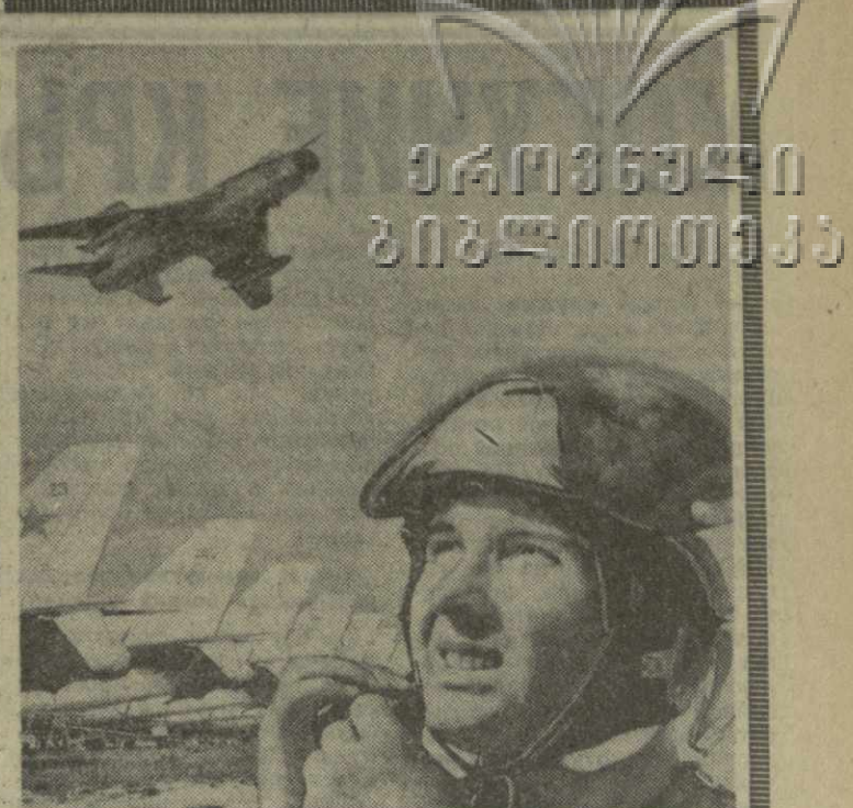
На страже советского неба. Фотомонтаж Н. Акимов и В. Савостьянова. (Фотохроника ТАСС).