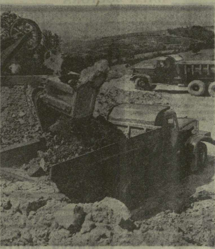
На снимках: 1. Передача бригадами гумбрина. 2. Члены бригады коммунистического труда Омар Силагадзе и Барлам Панцквара. 2. Добыча гумбрина на открытых карьерах.

Более чем 40 предприятий страны отгружается грузинские бригады. Они широко применяются в нефтяной и металлургической промышленности. На трудовом фронте в честь 50-летия образования СССР коллектив бригады добивается больших успехов. План семи месяцев по добыче гумбрина выполнен досрочно. Сверх задания выпущено 4.240 тонн отбеливающей глины. Ежедневно в различные концы нашей страны отгружается 450 — 500 тонн гучубана.