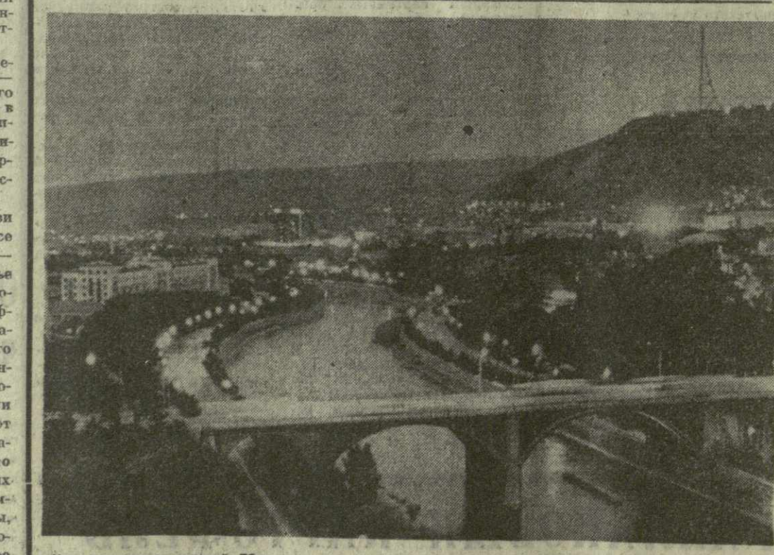
На снимке: ночной Тбилиси.

В очередном тираже «Спортлото», состоявшемся 20 августа, выигранный выпал на следующие номера: 9 (борьба), 12 (водно-моторный спорт), 25 (лыжка-тримплин), 33 (регби), 43 (фехтование), 45 (футбол). (ТАСС).