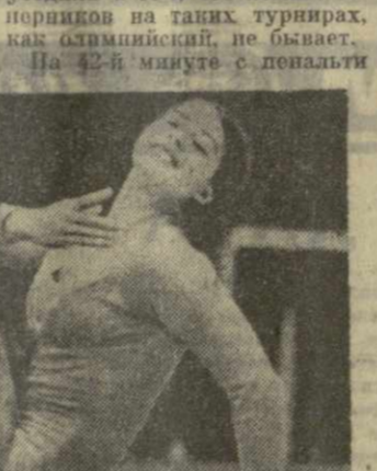
Людмила Турничева исполняет вольные упражнения.

Наша футбольная команда в своем поединке победила сборную Судана — 2:1 (2:0). Эта встреча еще раз убедила в том, что легкая соперники на таких турнирах, как олимпийский, не бывает. На 42-й минуте с пенальти