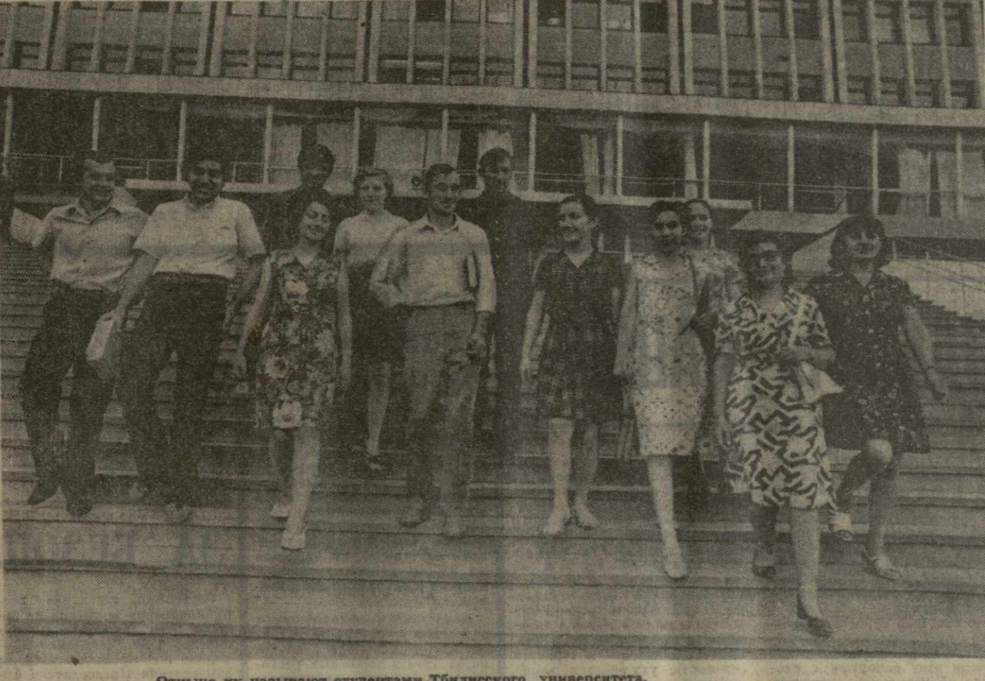
Отныне их называют студентами Тбилисского университета.

В настоящее время, когда с каждым годом в практику обучения вводятся все новые программы, возрастает ответственность педагога за качество, за результаты своего труда и повышаются требования к институту усовершенствования учителей, к органам народного просвещения республики, их методической помощи педагогам, к организации работы по повышению профессионального мастерства.