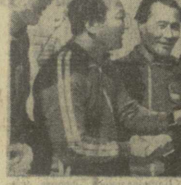
Семикратный чемпион мира и трехкратный олимпийский чемпион по волевой борьбе Александр Медведь в окружении спортсменов Монголии.