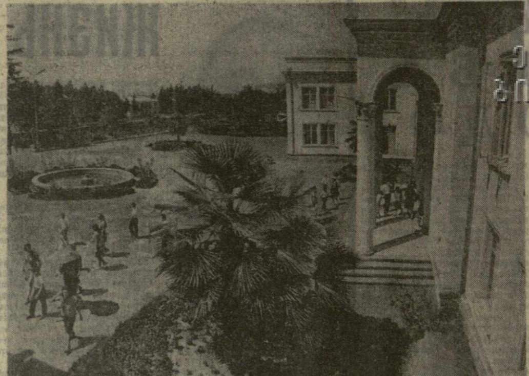
Дом культуры колхоза «Сакартвело» села Рухи Zugдидского района пользуется большой популярностью среди колхозников. Здесь работают кружки художественной самодеятельности, созданы ансамбли песни и танца, часто демонстрируются кинофильмы, читаются лекции, проводятся вечера отдыха. На снимке: у входа в Дом культуры.