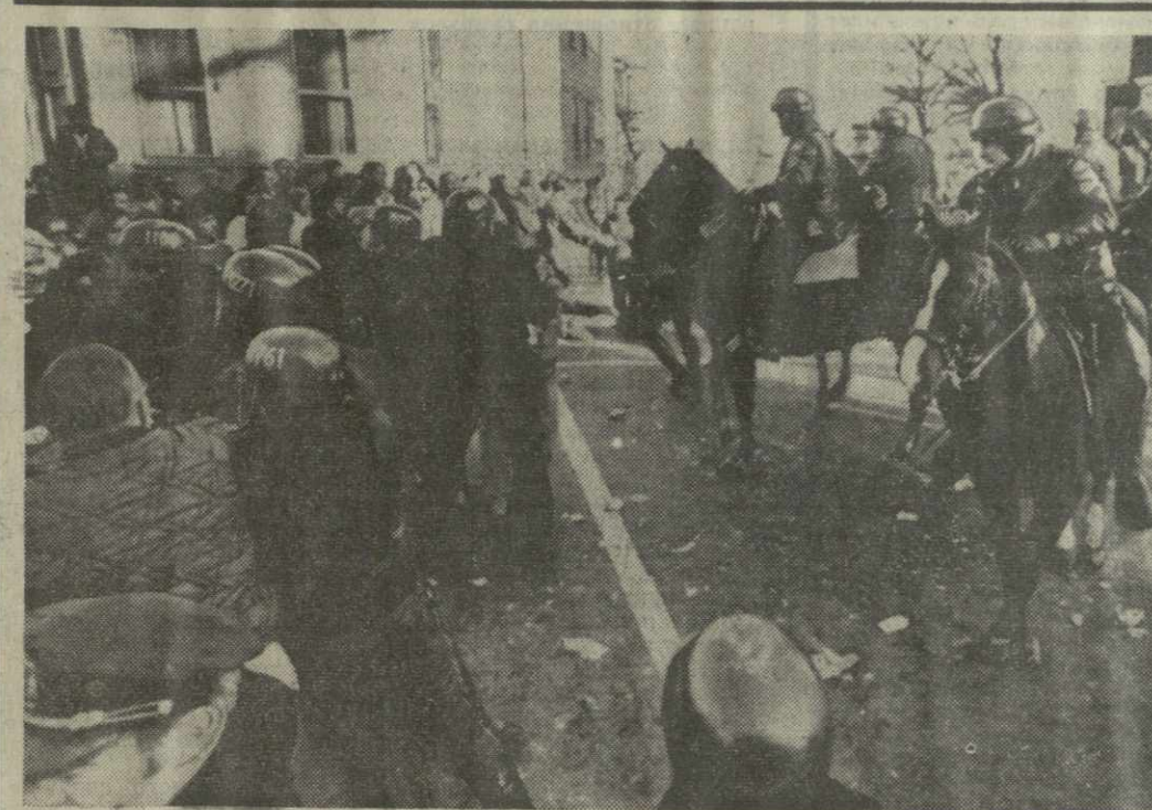
© США. Не прекращаются расовые волнения в Бостоне. Школьные власти отказались выпустить постановление о совместном обучении белых и негритянских детей. В городе по-прежнему сохраняется напряженное положение.

Государственный секретарь заявил далее, что правительство США считало и продолжает считать упорядоченные и взаимовыгодные торговые отношения с Советским Союзом важным элементом в общем улучшении отношений. Оно, безусловно, будет и впредь использовать для такого улучшения все имеющиеся средства, в частности, добиваясь принятия такого закона, который позволил бы установить нормальные торговые отношения.