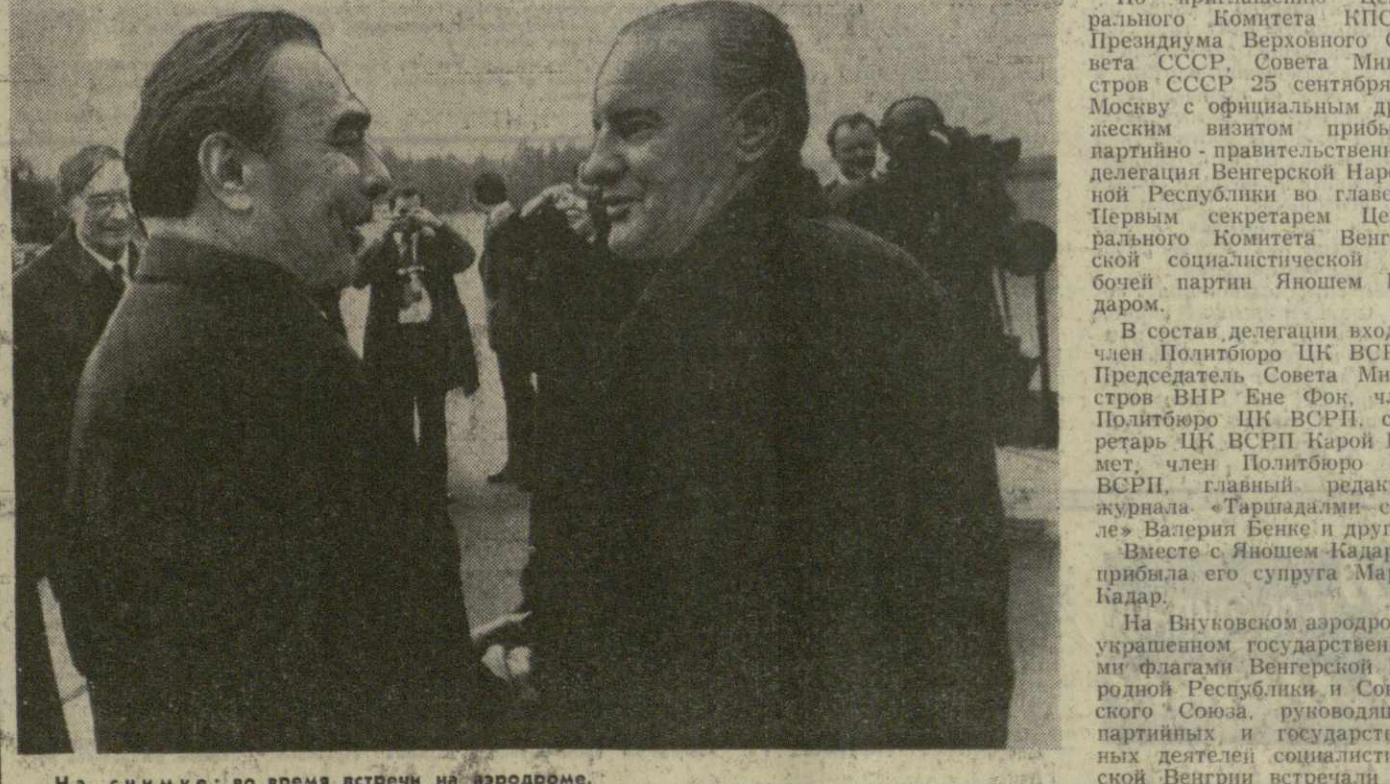
На снимке: во время встречи на аэродроме. Фото ТАСС. (Принято по фототелеграфу Грузинформ).