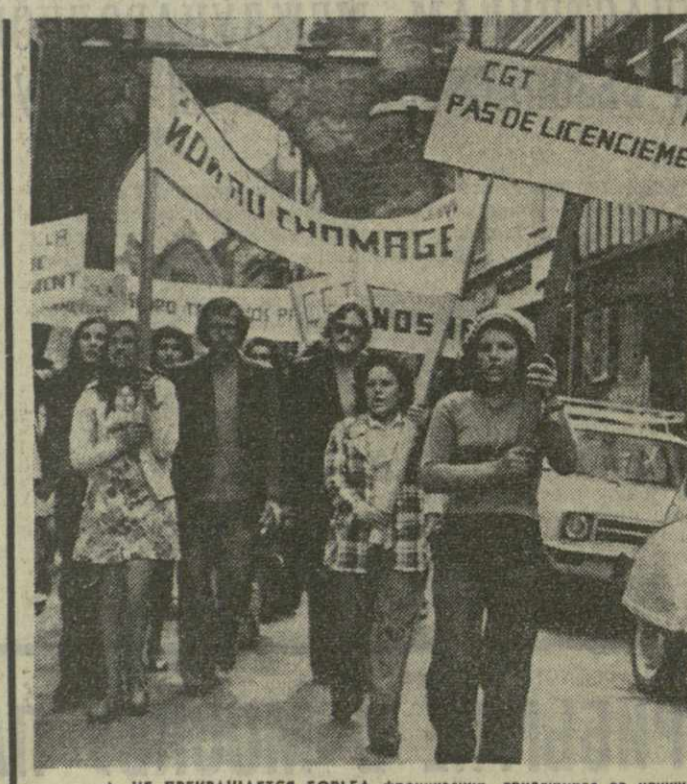
▲ НЕ ПРЕКРАЩАЕТСЯ БОРЬБА французских трудящихся за улучшение жизненных условий, за право на труд, против произвольных увольнений. Четверо митингуют у здания французского предприятия ИНОЗАВ, имеющего свои филиалы в разных городах Франции. Они добиваются пересмотра решений администрации о сокращении производства, которое повлечет за собой массовые увольнения.