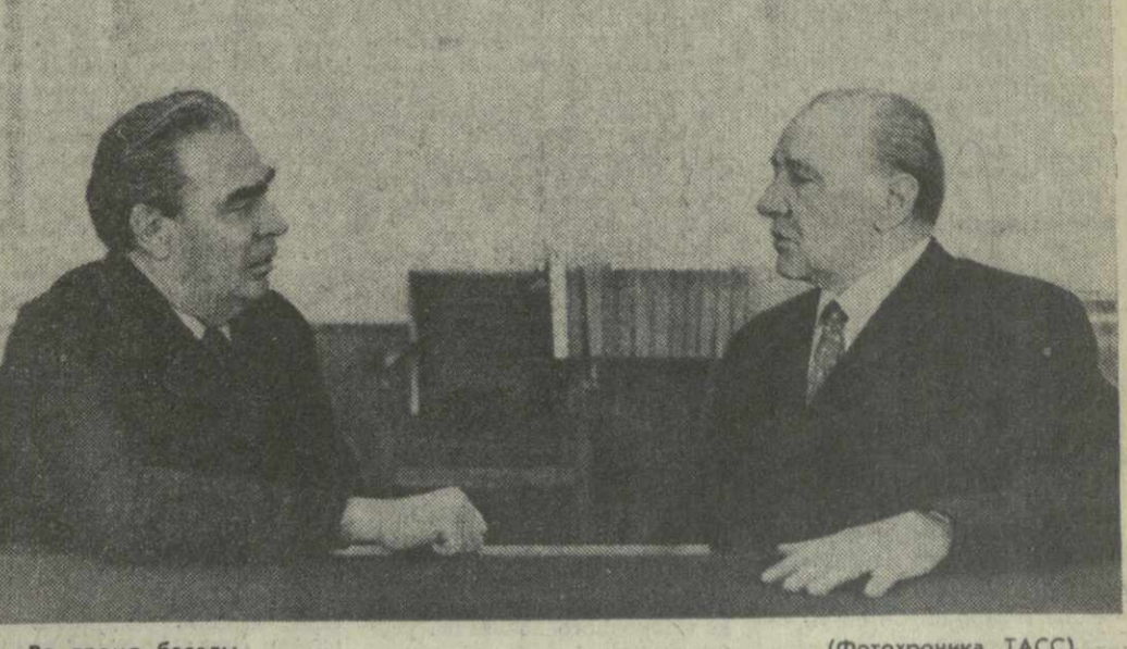
Во время беседы. (Фотокроника ТАСС).

29 сентября в Кремле состоялась встреча Генерального секретаря ЦК КПСС товарища Л. И. Брежнева с Первым секретарем ЦК ВСРП товарищем Яношем Кадаром. В ходе беседы были обсуждены вопросы дальнейшего расширения и углубления сотрудничества между Советским Союзом и Венгерской Народной Республикой во всех сферах жизни общества. При этом было подчеркнуто, что основой политического союза СССР и ВНР являются тесные, постоянно крепнущие связи и братская солидарность марксистско-ленинских партий обеих стран — КПСС и ВСРП. Товарищи Л. И. Брежнев и Я. Кадар обменялись мнениями по широкому кругу актуальных международных проблем, представляющих взаимный интерес. Особое внимание было уделено вопросам сотрудничества в области культуры, науки, техники, спорта и туризма. Брежнев и Я. Кадар прошли в братской, сердечной обстановке, в духе полного взаимопонимания и единства взглядов по всем обсуждавшимся вопросам.