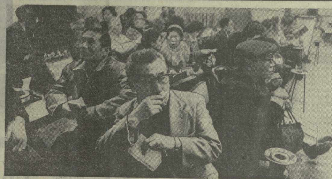
А ЯПОНИЯ. В результате углубляющегося экономического кризиса в стране одно за другим закрываются промышленные предприятия. Число банкротств компаний за год перешло далеко за 10 тысяч — отметку, которая когда-то была рекордной. В настоящее время в Японии насчитывается около 800 тысяч безработных. К весне этого года, как полагают министерство труда, их число возрастет до 1-1,5 миллиона человек.

В тот же день забастовочные шкеры появились и в водорозливных предприятиях