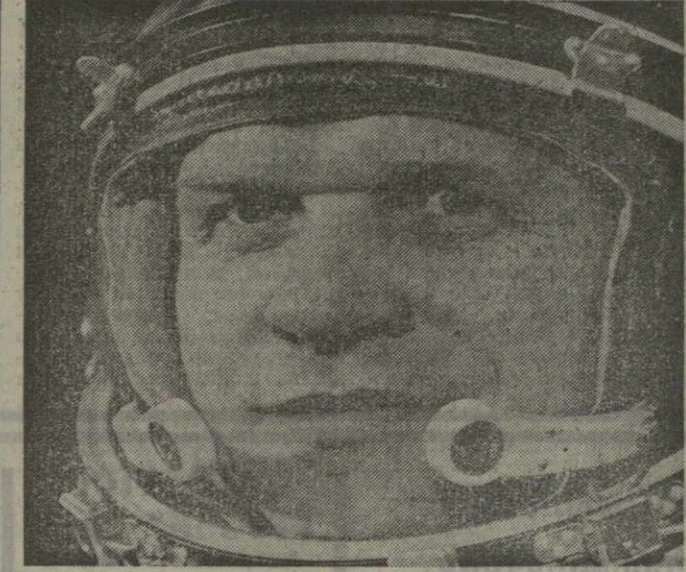
Командир космического корабля «Союз-17» Алексей Губарев.