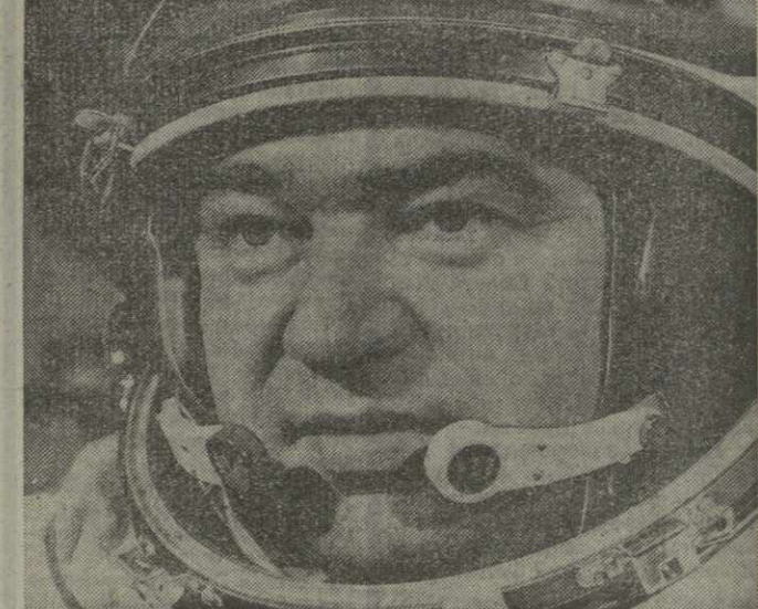
Бортинженер космического корабля «Союз-17» Георгий Гречко.