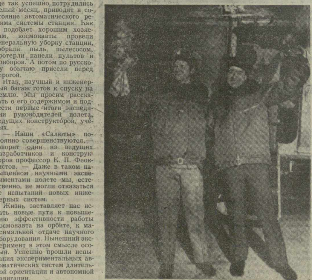
На снимке: советские космонавты Алексей Губарев и Георгий Гречко после приземления.

Делегации СССР и США возобновили в Москве 10 февраля переговоры по вопросам, касающимся подведения ядерных взрывов в мирных целях. В ходе советско-американской встречи во Владивостоке, как известно, было условлено продолжить активные переговоры в ближайшее время. По указанным вопросам делегация СССР на переговорах возглавляет И. Д. Морозов, первый заместитель председателя Государственного комитета по использованию атомной энергии СССР; делегацию США — Уолтер Дж. Стессел, посол США в СССР.