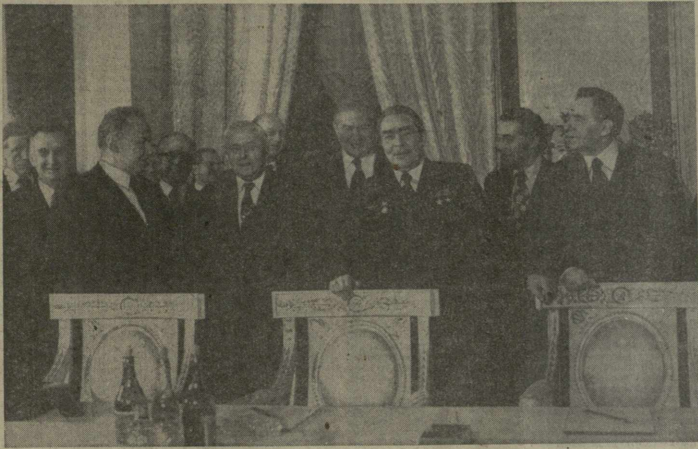
На снимке: перед началом советско-английских переговоров.