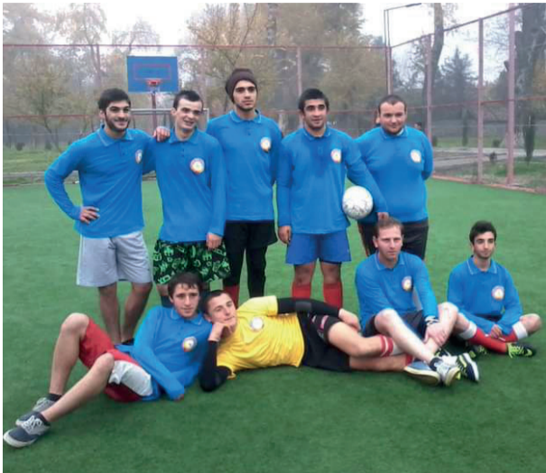
საქართველო-უკრაინის სოციალურ ურთიერთობათა ინსტიტუტის ქალაქ რუსთავის სასწავლო ცენტრის ფეხბურთელი ბიჭები