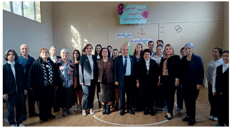
– „ორპირ ქარში მოცეული, „საომარი ლელო“ ხარ, ჩემი დედა-მშობელი და ჩემი საქართველო ხარ...“