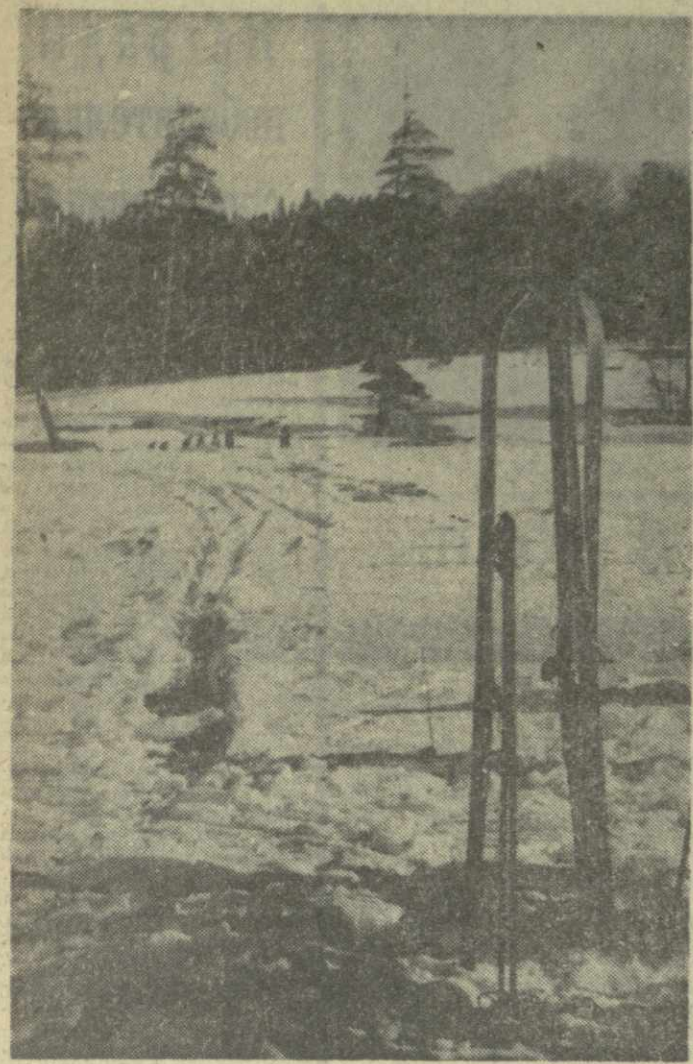
▲ КРАСИВ БАКУРИАНИ — СТОЛИЦА ЗИМНИХ ВИДОВ СПОРТА. Высокогорный поселок привлекает гостей со всех концов нашей страны и из-за рубежа. Не была нарушена эта добрая традиция и нынешней зимой.

На склонах Бакуриани уже состоялись ответственные соревнования лыжников, прыгунов на лыжах с трамплина, биатлонистов. В начале марта здесь состоится один из этапов розыгрыша Кубка СССР по горнолыжному спорту.