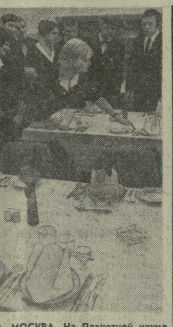
М. МОСКВА. На Планетной улице расположена не совсем обычная школа. В нее поступают юноши и девушки, уже имеющие среднее образование, и здесь их учат искусству обслуживания.

В середине марта в Германскую Демократическую Республику выедут самодельные коллективы Тбилисского государственного университета.