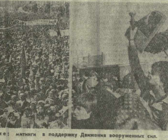
▲ ЛИССАБОН. На снимке: митинг в поддержку Движения вооруженных сил.

НЬЮ-ЙОРК, 14 марта. (ТАСС). Аляска вновь, как и в прошлом, веке, одождно влечет к себе многих американцев. Впрочем, на этот раз не золотым жилам Юкона. И не отчаянным искателям, жаждущих быстрого обогащения. Сюда в поисках заработка потянулись аламоушцы и безработные со всех концов Соединенных Штатов. Оборудованные американскими компаниями строительные транзитные нефтепровода, что давно уже добываются нефтяные, строительные и другие материалы, вызвало и жгучий интерес для этого края «бума». Удочившим последствием является подписание контракта, и теперь им предстоит лишь «дотянуть» до начала строительных работ. Но в эти дни на Аляске горит большое дружба — тем, кому безработица оказалась невыносимой, и тем, кто не имеет возможности обзавестись собственным жильем.