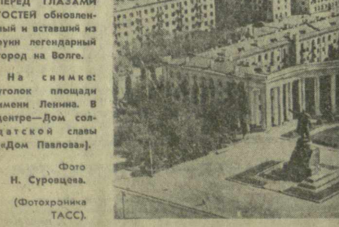
На снимке: уголок площади имени Ленина. В центре — Дом солдатской славы («Дом Павлова»).