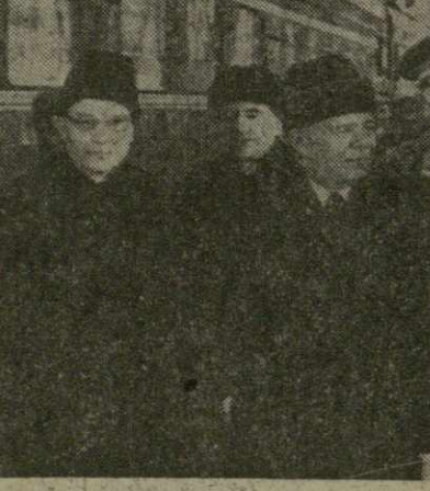
21 марта в Москву из Будапешта возвратился Генеральный секретарь ЦК КПСС товарищ Л. И. Брежнев, возглавлявший делегацию Коммунистической партии Советского Союза на XI съезде Венгерской социалистической рабочей партии. На снимке: во время встречи на Киевском вокзале.