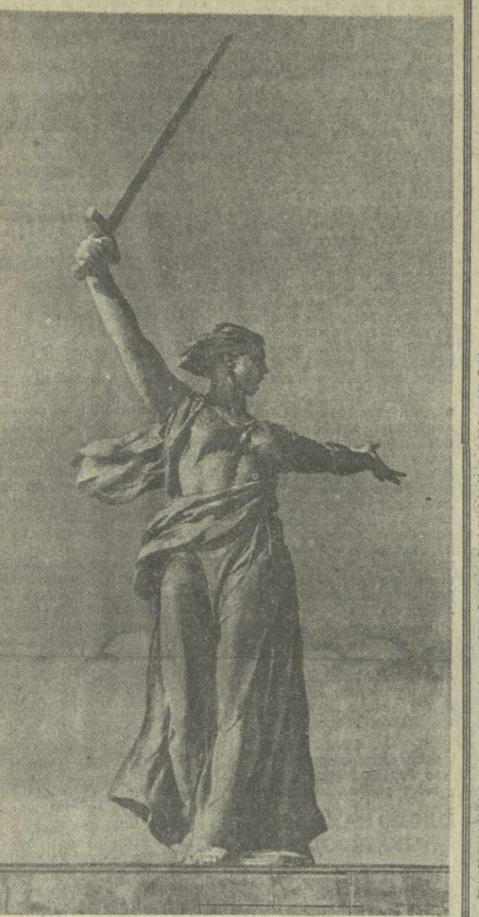
▲ ВОЛГОГРАД. Главная скульптура памятника-ансамбля в честь героев Сталинградской битвы — Родина-Мать.