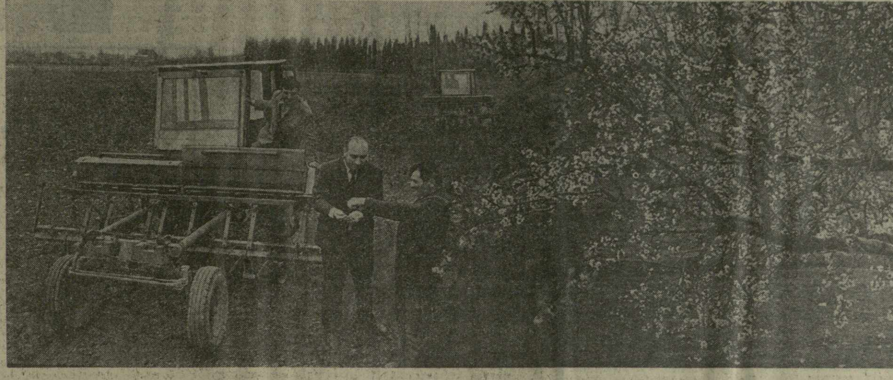
На снимке: идет сев овощей.

№ 68 (15132) ● СУББОТА, 22 МАРТА 1975 ГОДА ● Цена 2 коп.