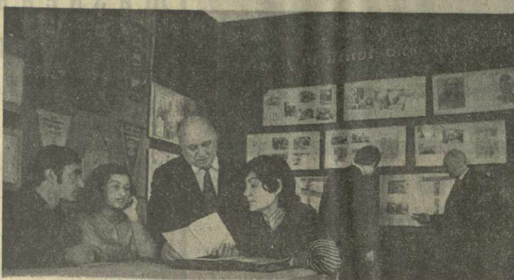
▲ В ГОДЫ ВЕЛИКОЙ ОТЕЧЕСТВЕННОЙ ВОЙНЫ более 600 рабочих и служащих Тбилисского электротехноремонтного завода им. И. В. Сталина ушли на фронт, многие из них не вернулись с полей сражений.

26 марта 1975 года в Советском Союзе произведен запуск очередного искусственного спутника Земли «Космос-721». На борту спутника установлена научная аппаратура, предназначенная для продолжения исследования космического пространства. (ТАСС).