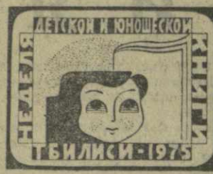
Мехико М. ПИНОШЕКО. ТБИЛИСИ-1975

Я впервые приехал в Грузию, хотя очень много слышал об этом гостеприимном крае, хорошо знаком с культурой вашего народа, у меня очень много грузин — фронтовых друзей.