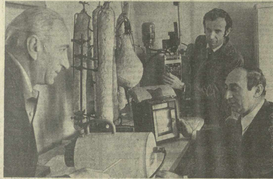
▲ КАК РАЦИОНАЛЬНЕЕ ИСПОЛЬЗОВАТЬ ТЕПЛО геотермальных источников в сельском хозяйстве. Это одна из проблем, над которой работают сотрудники Грузинского научно-исследовательского института механизации и электрификации сельского хозяйства имени К. Амираджиби.

Сессия заслушала также отчет постоянной комиссии по дорожному строительству, транспорту и связи Юго-Осетинского областного Совета.