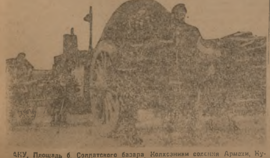
АНУ. Площадь 6. Солдатского базара Колхозники окрестности Армави, Кубанского района, прибыли на колхозную ярмарку.

БАКУ , 13. (ЗТА). С начала ярмарки в Баку продано 653 тонны крупного рогатого скота и мелкого — 1,343. Молочных продуктов — 75 п.т. Картофеля — 622 п.т. лука — 291 п.т. фруктов — 1,392 шт. и много других продуктов.