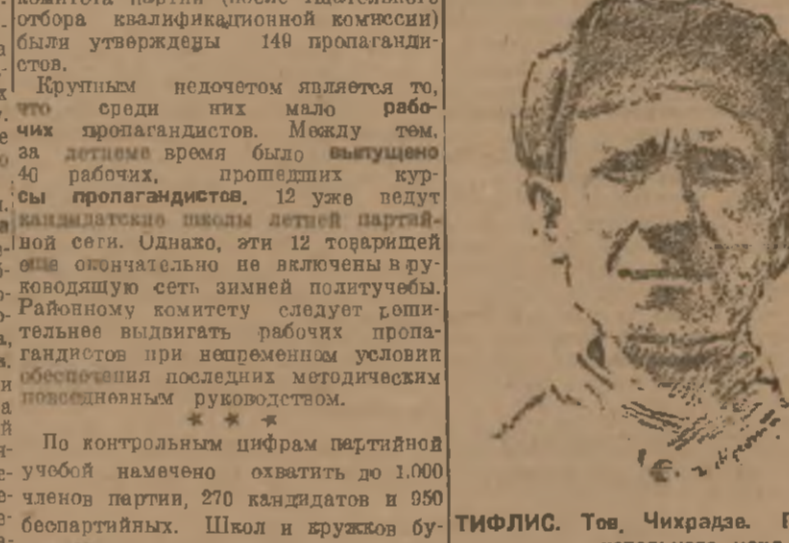
Парторганизация завода им. Сталина строит партучебу с учетом особенностей работы. Школа и кружки организованы по цехам, что повышает ответственность каждой ячейки за учебу и требует твердого обеспечения каждой смены пропагандистом...