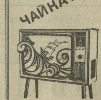
Многообразный и всегда неповторимый мир искусства открывает перед зрителем занавес эмблемой «Чайка». Многообразный и всегда неповторимый мир позаний принесет в каждый дом телевизор «Чайка». Цена — 380 руб. Центральная коммерческая организация «Радио-техника».

«Клуб кинопутешествий». 18.45 — «Готовимся к VI Спартакаде народов СССР». 19.10 — На страже законности (повторно). 19.25 — Цветное телевидение Грузии. «Музыкальная программа». 20.05 — Польский телевизионный многосерийный художественный фильм «Ставка больше, чем жизнь» (18-я серия, на грузинском языке). 21.05 — «Моабе» — информационная программа. 21.25 — Цветное телевидение Грузии. «Поет вокально-инструментальный ансамбль «Цицината»». 21.50 — Киноцерк. 22.00 — Из Москвы. «Время» — информационная программа. 22.30 — «Танцует Вера Цигладзе». По второй программе. 18.05 — Для детей. Веселая кинопрограмма. 19.05 — Концерт. 19.45 — Художественный фильм. 21.15 — Цветное телевидение Грузии. «Старая городская поэзия» (повторно).