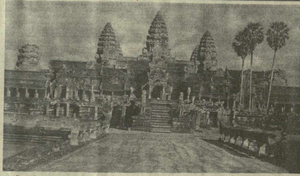
Слова Пьера Лоти, колдовских обаяний, сакральной создавшему ему народ всемирную славу.

К сожалению, действительность оказалась куда трагичнее: очередной заговор в марте 1970 года стал роковым для правительства Сианука.