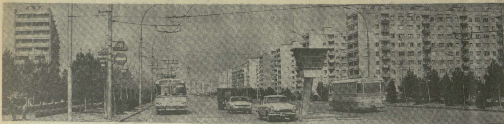
▲ РУСТАВИ. Проспект Дружбы.