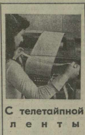
С телетайпной лентой