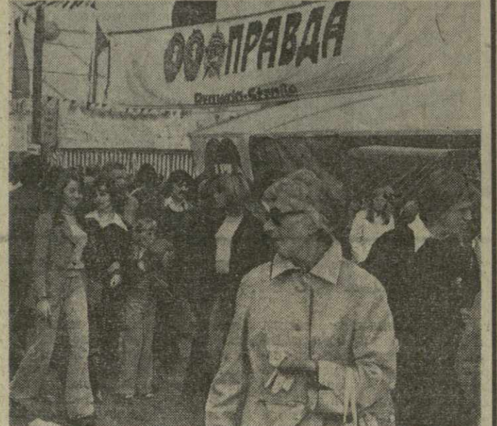
ФРГ. Первый праздник центрального печатного органа Германской коммунистической партии — газеты «Изере цайт» — состоявшийся в Дюссельдорфе, продемонстрировал рост авторитета партии, притягательную силу ее идеалов для населения страны.

На снимке: улицы праздничного палаточного городка носила название центральных печатных органов коммунистических и рабочих партий разных стран.