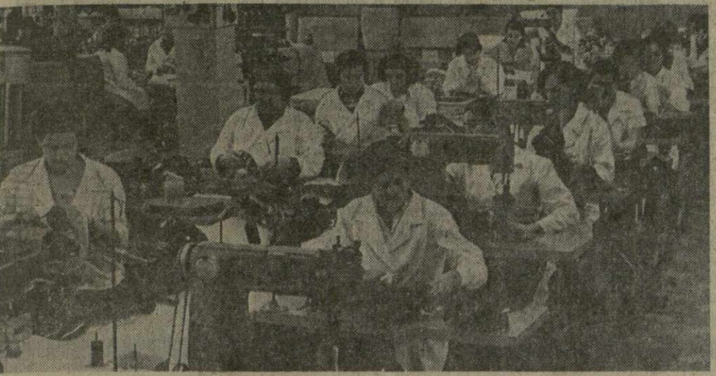
КОЛЛЕКТИВ КУТАИССКОГО КОЖОВУВНОГО КОМБИНАТА с пристрастием выполняет план девяти месяцев четвертого, определяющего года пятилетки. Коллектив экспериментального цеха систематически работает над созданием новых моделей. На снимке: общий вид экспериментального цеха.

№ 250 (15011) ПЯТНИЦА, 25 ОКТЯБРЯ 1974 ГОДА Цена 2 коп.