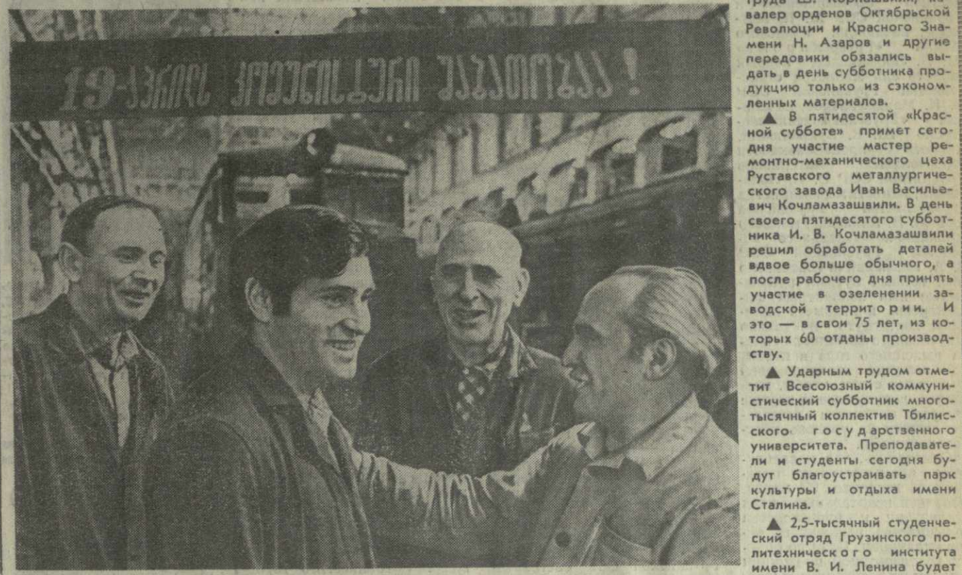
СОТНИ РАБОЧИХ И СЛУЖАЩИХ Тбилисского электровозостроительного завода им. В. И. Ленина выйдут сегодня на коммунистический субботник и внесут достойный вклад в фонд пятилетки.

Внешняя политика КПСС и Советского государства является последовательно классовая, ленинская политика, отвечающая чаяниям всего трудящегося человечества. «Создать в мире такой климат, при котором потенциальные агрессоры, любители авантюры и бражничества будут встречать все более решительный и повсеместный отпор народов, при котором мир, безопасность и уверенность в мирном будущем будут на деле становиться достоянием все более широких масс в различных районах земли, — вот цель, которую и думает о прогрессе человечества», — заявил на XI съезде ВСРП товарищ Л. И. Брежнев, выражая единую волю нашей партии и народа.