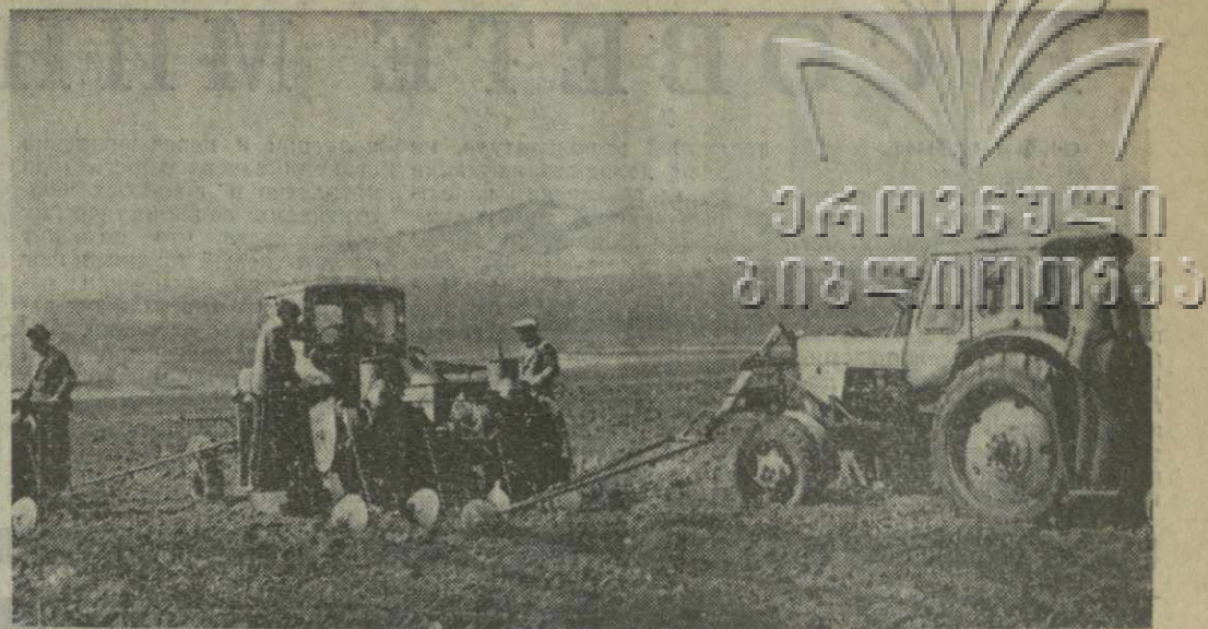
▲ МЕХАНИЗАТОРЫ колхоза имени Орджоникидзе села Гантнеди Дманисского района завершают сев картофеля. С каждого из 50 гектаров они обещают получить по 120 центнеров клубней при плане 117.

На снимке: сев картофеля в колхозе села Гантнеди.