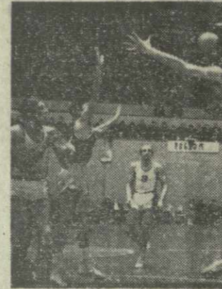
на А. Коби. Однако именно он судил обе наши игры.

Четыре матча в Прибалтике мы проиграли. В психологическом плане это сказалось на действиях команды, и мы долго не могли вбить себя в ритм. Но поражение порождало уверенность в себе, что плохую службу оказало нам тенденциозное судейство. Так, например, руководству «Динамо» обещали, что в Каунасе от судейства будет отстранен арбитр из Талли-