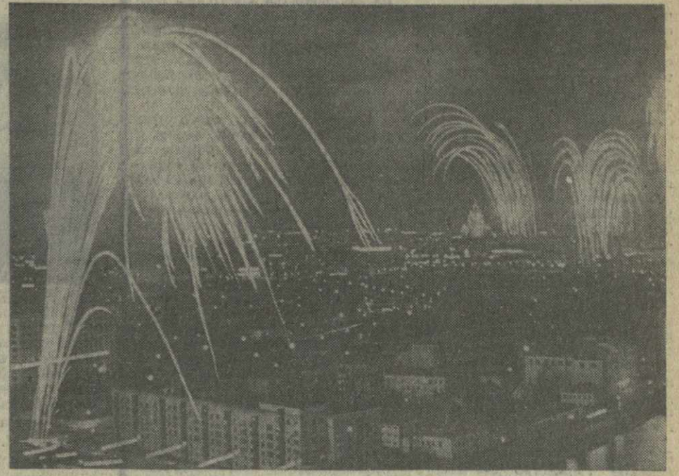
Салют Победы в столице нашей Родины — Москве. (Фотохроника ТАСС).

[Из постановления Центрального Комитета КПСС «О 30-летию Победы советского народа в Великой Отечественной войне 1941—1945 годов»].