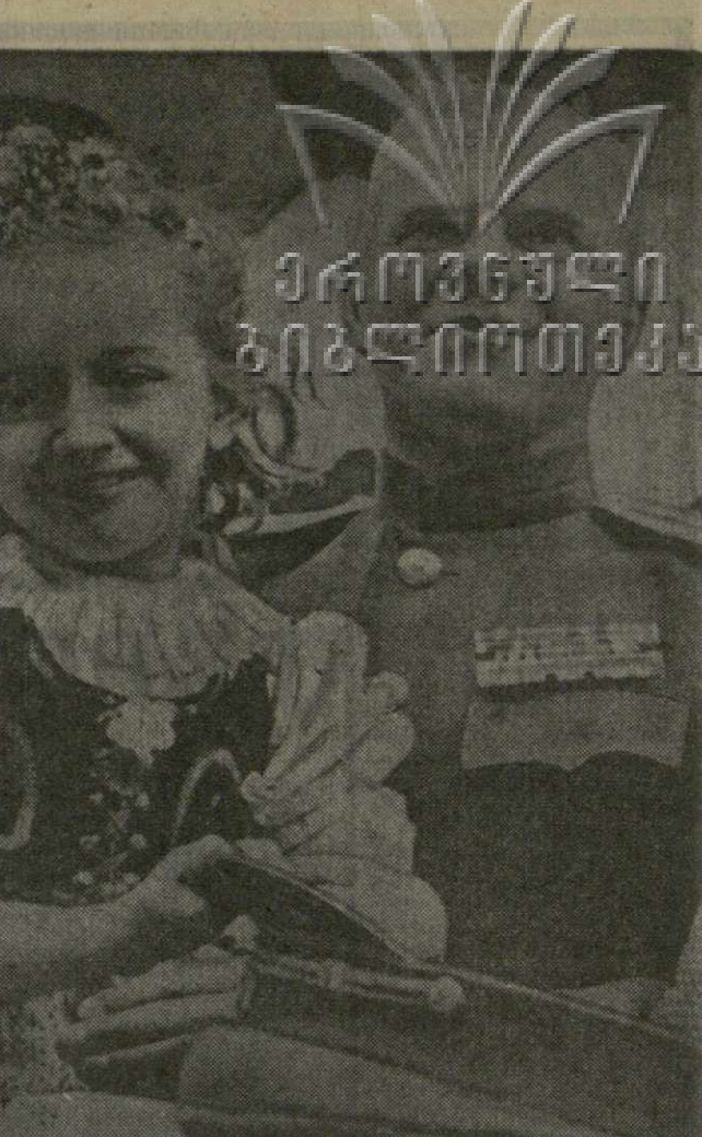
На снимке: пусть будет счастлива эта маленькая чешская девочка. (Фотохроника ТАСС).

Карел БЕРАНЕК, секретарь Пражского городского комитета КПЧ. (АПН).