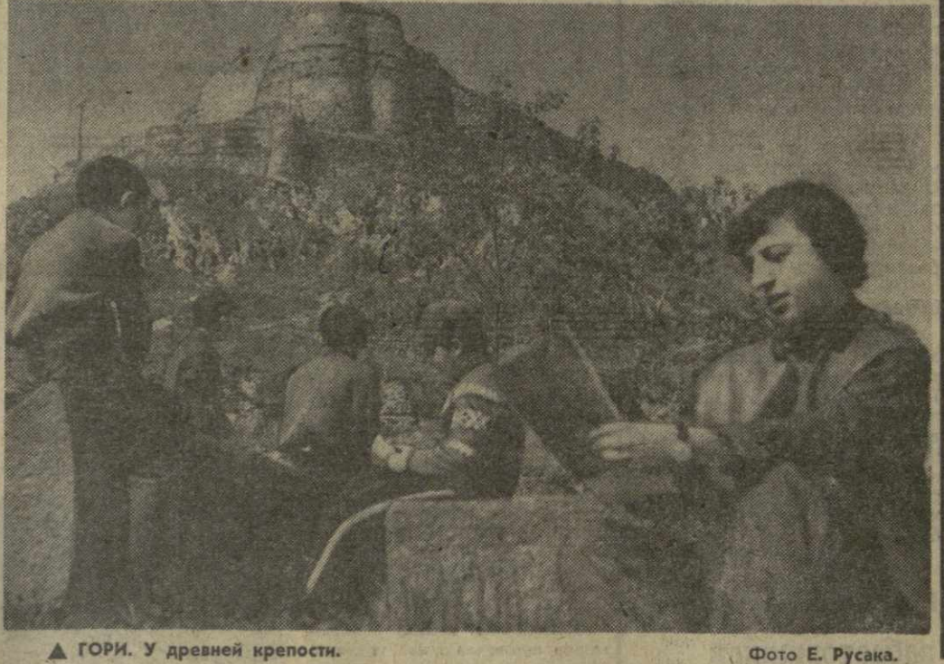
▲ ГОРИ. У древней крепости.

Трагически сложилось восхождение английской экспедиции на гималайский пик Нутте высотой 7,925 метров. По сообщению министерства иностранных дел Непала, двое участников восхождения, считавшихся пропавшими без вести, погибли под снежной лавиной. Таким образом, число жертв в текущем дьявольском сезоне, начавшемся в апреле, достигло 10 человек. Самые крупные потери понесла группа японских спортсменов, совершавшая в апреле этого года восхождение на пик Дхаулагири, когда погибло пятеро его участников, в том числе трое проводников-шерпов. (ТАСС).