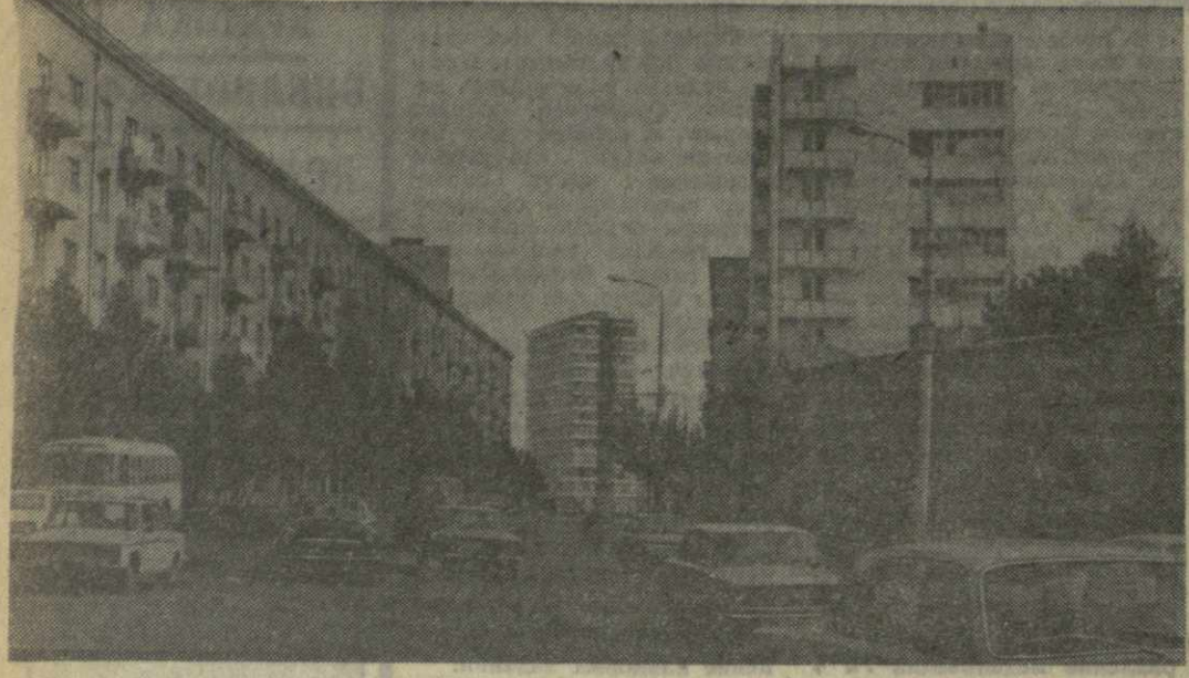
ТБИЛИСИ. Улица Гурамшвили.