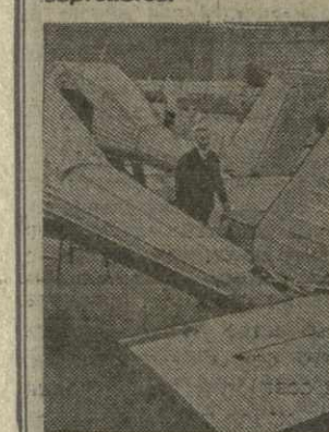
На снимке: сборка сельскохозяйственных самолетов в цехе Варшавского завода транспортного оборудования.

Самолетостроение — одна из наиболее современных и динамично развивающихся отраслей промышленности народной Польши. На основе соглашений, подписанных между странами — членами СЭВ, ПНР специализируется на производстве сельскохозяйственных самолетов и легких вертолетов.