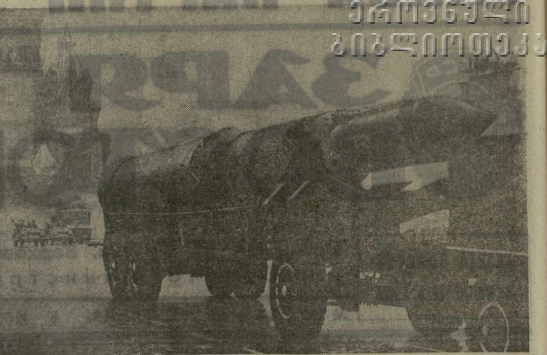
Москва, 7 ноября 1974 года. Празднование 57-й годовщины Великой Октябрьской социалистической революции. Военный парад на Красной площади.

В праздничном убранстве Москвы отражены успехи и труженников села: несмотря на неблагоприятные погодные условия, в стране собран хороший урожай. Все союзные республики внесли вклад в обеспечение страны хлебом и другими продуктами земледелия и животноводства. В итогах года, в повышении темпов развития сельского хозяйства со всей убедительностью проявляются смена