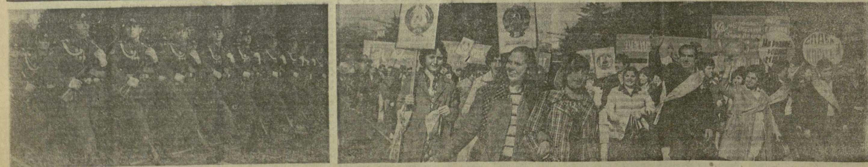
Тбилиси, 7 ноября 1974 года. На снимке: парад войск Тбилисского гарнизона и демонстрация представителей трудящихся на проспекте Руставели.