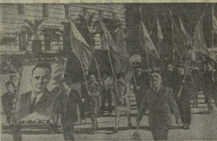
На снимках: демонстрация представителей трудящихся в Сухуми, Батуми и Цхинвали.

Праздник Великого Октября шестует по земле Юго-Осетии. С самого раннего утра оживленно на ули-