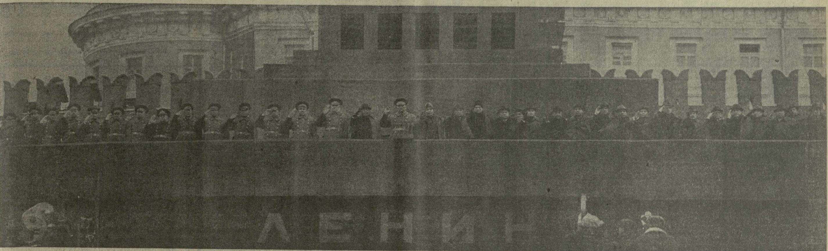
Москва, 7 ноября 1974 года. Красная площадь. Празднование 57-й годовщины Великой Октябрьской социалистической революции. На снимке: на трибуне Мавзолея В. И. Ленина.