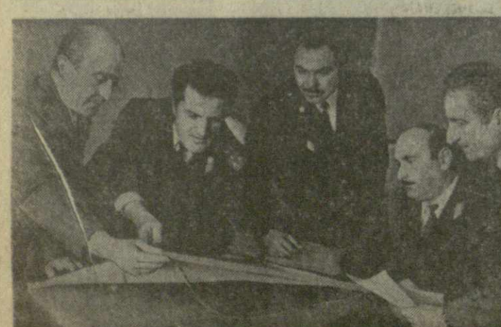
КАК БОЛЬШОЙ ВСЕНАРОДНЫЙ ПРАЗДНИК отмечает ежегодно наша страна труд людей, стоящих на страже покоя и безопасности каждого из нас.

Одна из таких форм — опорные пункты обществен-