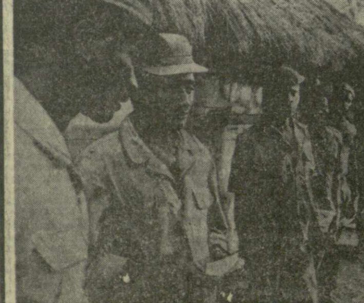
На снимке: председатель Государственного совета Республики Гвинея-Бисау Луис Кабрал беседует с бойцами освободительной армии.

Убыль горняков на южноафриканской шахте — постоянное явление. Владыки шахт не принимают никаких мер безопасности, начиная с того же года горняки погибли на девяти других африканцев. (ТАСС).