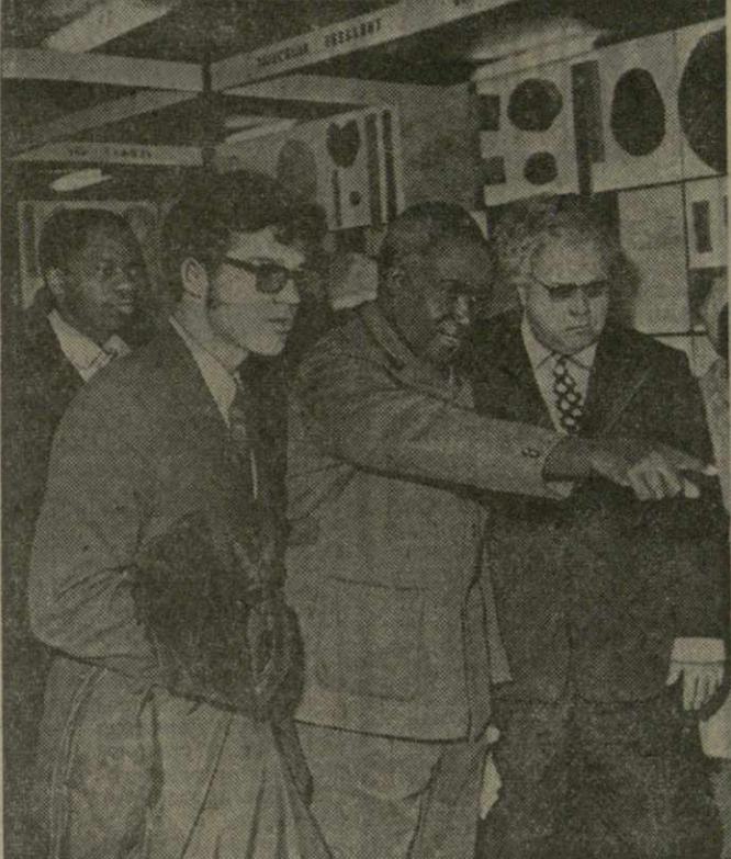
Тбилиси, 25 ноября. Президент Республики Замбия Кеннет Д. Каунда в дендрологическом музее Грузинского сельскохозяйственного института.