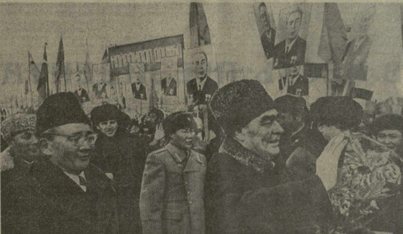
На снимке: во время встречи в аэропорту. Фото ТАСС. (Принято по фототелеграфу Грузинформ).