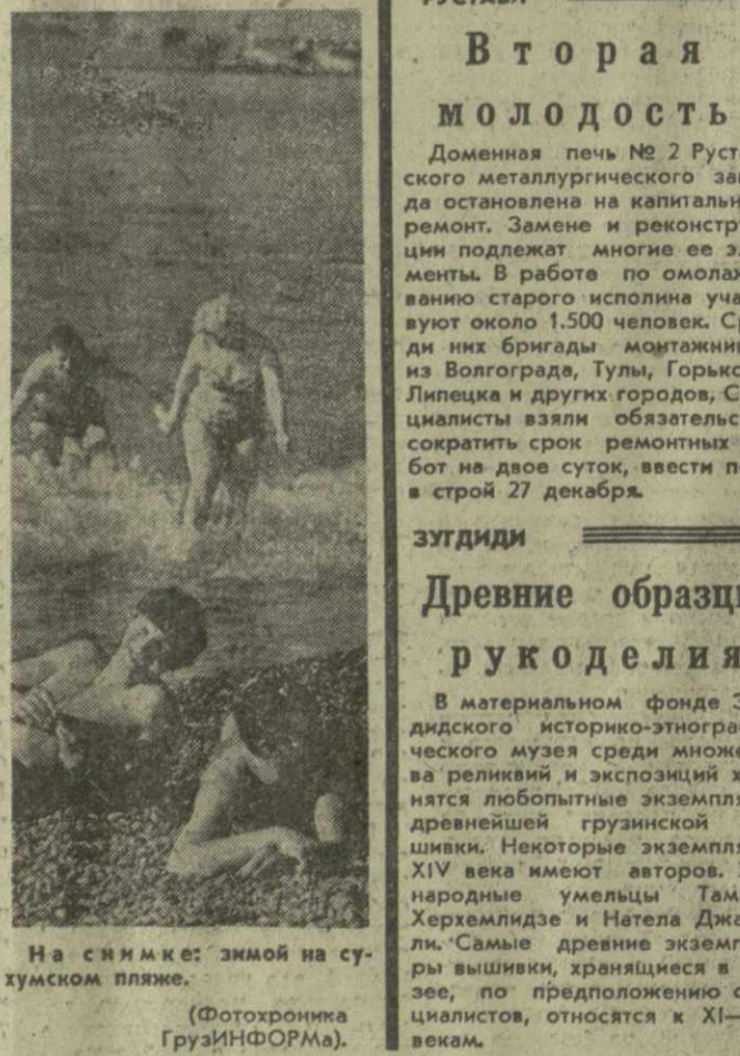
На снимке: зимой на сухумском пляже.

В пансионатах и домах отдыха Аджарии набирают силы сотни москвичей, ростовчан, трудящихся Севера и Дальнего Востока. Гостеприимно встречает гостей и столица Абхазии. Здесь туристы могут посетить Ботанический сад Академии наук, объезжая питомник. Как всегда, многолюдно и на сухумском пляже. Если повезет, пригрет солнце воду, то найдется и любителям зимнего купания.