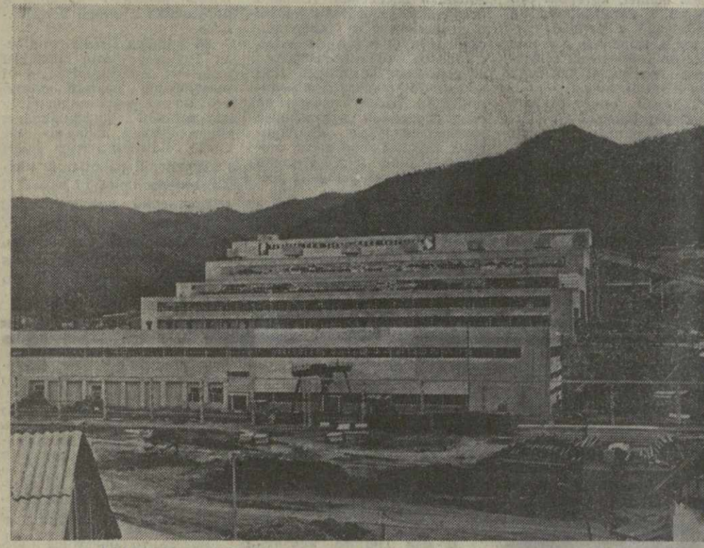
♦ ГЛАВНЫЙ КОРПУС Маднеульского горно-обогатительного комбината. Здесь установлено совершенное оборудование, которое обеспечивает эффективную переработку руды.

ПЕРВЕНЕЦ ГРУЗИНСКОЙ ЦВЕТНОЙ МЕТАЛЛУРГИИ НАКАНУНЕ ПУСКА. НИЖЕ РАССКАЗЫВАЕТСЯ, КАК СТРОИЛСЯ МАДНЕУЛЬСКИЙ ГОРНО-ОБОГАТИТЕЛЬНЫЙ КОМБИНАТ.