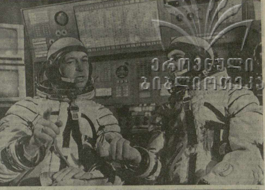
На снимке: экипаж космического корабля «Союз-18» — командир корабля П. И. Климух (справа) и бортинженер В. И. Севастьянов — во время предполетных занятий на тренажере корабля «Союз».