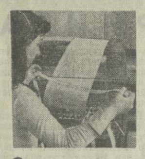
С телетайпной ленты