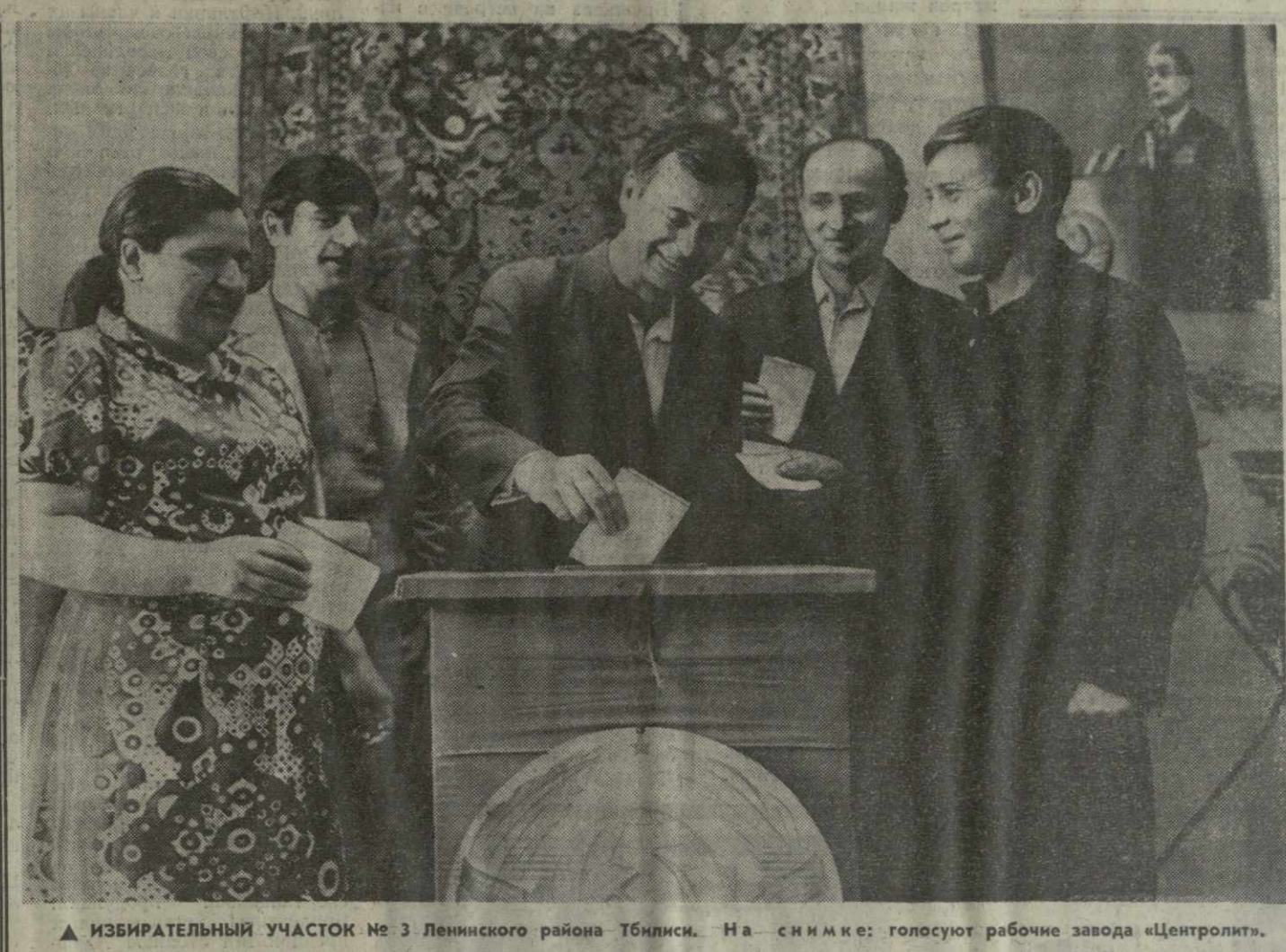
▲ ИЗБИРАТЕЛЬНЫЙ УЧАСТОК № 3 Ленинского района Тбилиси. На снимке: голосуют рабочие завода «Центролит».