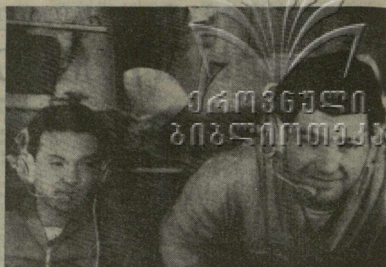
▲ ЦЕНТР УПРАВЛЕНИЯ ПОЛЕТОМ. Программа полета астронавта орбитальной научной станции «Салют-4» успешно выполняется.

Алексей ГОРОХОВ, специальный корреспондент АПН, Центр управления полетом.