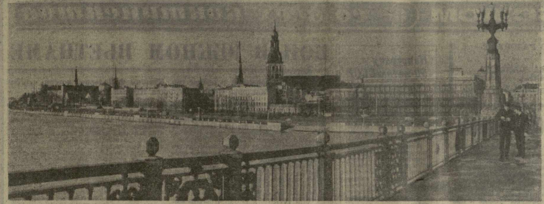
Рига — столица Советской Латвии. На снимке: вид на набережную Риги с моста через Даугаву.

ЛАТВИЯ — одна из 15 союзных республик, образующих могучий, подернутый распутием народнохозяйственный комплекс, в котором идет речь в постановлении ЦК КПСС «О подготовке и 50-летию образования Союза Советских Социалистических Республик». Сегодня наша республика, как и вся Советская страна, живет под знаком осуществления исторических решений XXIV съезда КПСС, воплощая в жизнь делового пятилетнего плана развития народного хозяйства.